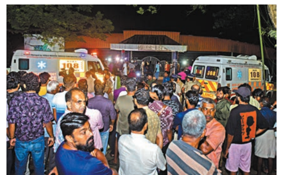
◆事發後大批人聚集在現場一帶。

人踩人，造成115人死亡。2008年9月，西部拉吉斯坦邦佐德坡地區的大神梵天寺廟發生信徒互相推擠踐踏事件，多達224人死亡。