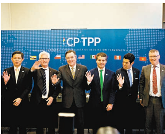
◆CPTPP成員早前舉行會議。

英國新任外相卡梅倫上周在上議院就英國加入CPTPP首次發表講話，稱這將使「英國位於世界上一些最具活力的經濟體的中心」。但工黨副黨魁柯林斯表示，加入CPTPP絕不能彌補政府至今未能與印度或美國達成貿易協議的損失。