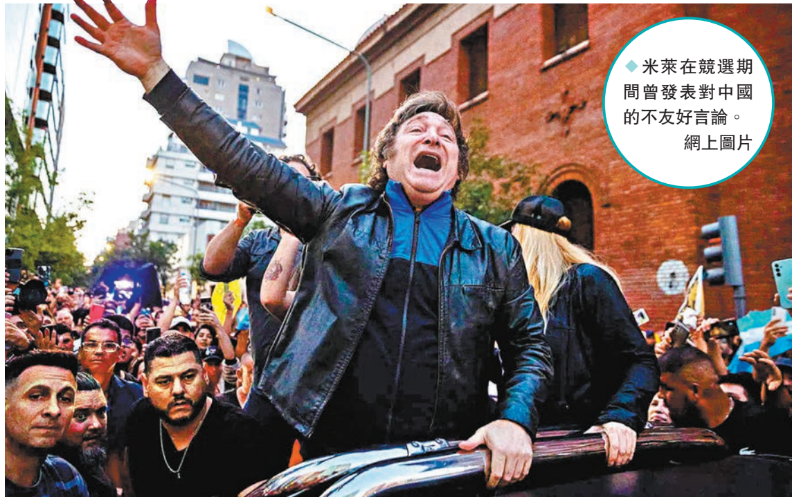
◆米萊在競選期間曾發表對中國的不友好言論。

蒙迪諾上周接受TN新聞電視台訪問時，對外界流傳有關「阿根廷將與中國和巴西斷絕關係」