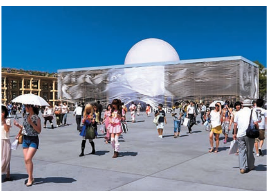
◆2025年日本世博大阪會場設計圖。 網上圖片

尹錫悅政府非常重視申辦世界博覽會。若韓國最後順利爭取到2030年世博會主辦權，日本大阪作為2025年世界博覽會主辦城市，日本政府有意跟韓國分享主辦大阪關西世博的經驗。