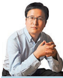
宋清輝 著名經濟學家

世界經濟當前的發展前景中充滿了諸多不確定性因素，中美關係進一步緩和有助於消除一部分不確定性。2023年11月14日至17日，應美國總統拜登邀請，國家主席習近平赴美國舊金山(三藩市)舉行中美元首會晤，同時應邀出席亞太經合組織第三十次領導人非正式會議。國際輿論普遍認為，這次訪問舉世矚目、成果豐碩、意涵深遠，將為世界經濟的發展注入更多的正能量。