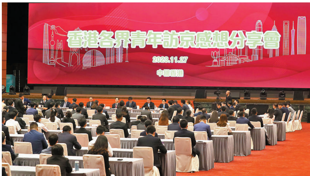
◆香港青年聯會昨日舉行「香港各界青年訪京感想分享會」，邀請青年訪京團團員分享訪京感受。

來。習近平主席一直心繫香港青年，希望廣大香港青年厚植家國情懷，錘煉過硬本領，早日成長為可堪大任的棟樑之才。11月22日，丁薛祥副總理與「港澳青年看祖國」的各界港澳青年代表交流團座談時，勉勵港澳青年深刻認識國家和世界發展大勢，切實增強民族自豪感和主人翁意識，在新時代展現出新擔當、新作為、新氣象。劉光源指出，這與習近平主席的重要講話精神是一脈相承的，再一次充分體現中央對香港青年的關愛之切、寄望之深。