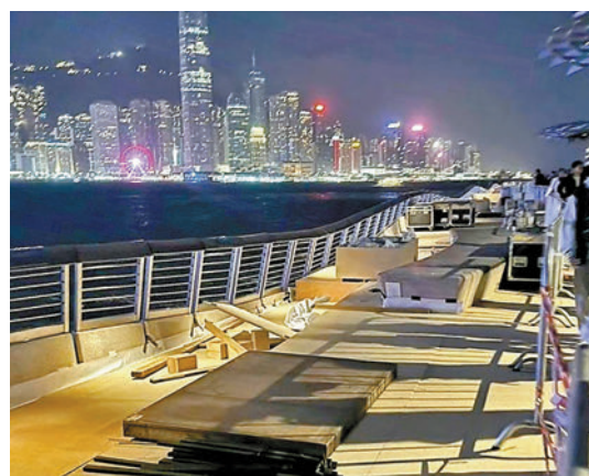
◆近日星光大道開始局部封閉為時裝展進行搭建工程。

警方表示，近日發現有騙徒在網上交易平台兜售所謂的「門票」，聲稱可憑票參加本週四（30日）晚上在尖沙咀星光大道一帶舉行的活動。惟上述活動屬私人性質，主辦單位並沒有向公眾發售所謂的「門票」，只准受邀人士參加，而獲邀人士於活動當日亦須經由主辦單位核實身份才能進入活動範圍。警方呼籲公眾切勿誤信網上謠言，墮入騙徒陷阱。