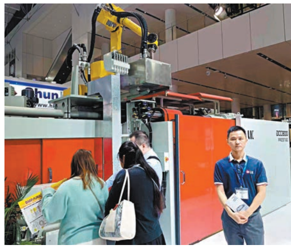
◆力勁科技推出的先進一體化鑄造機可以很好地助參力新能源車商提高生產效率和降低成本。