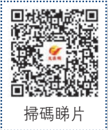
◆圖文：香港文匯報記者 李昌鴻 深圳報道

為推動大灣區智能製造和新型工業化，由港企訊通展覽舉辦的DMP大灣區工業博覽會（下稱「DMP工博會」）於27日至30日在深圳國際會展中心舉行，此次展會面積高達24萬平方米，創歷史新高。展會吸引超過2,200家內地和香港等企業，其中香港鑄造業總會、香港模具協會和香港三維打印協會等組織會員共計80多家港企踴躍參展。隨着中國內地及海外市場新能源汽車熱銷，今年工博會中，港企在新能源汽車產業布局產品種類日益豐富，訂單亦有較快增長。