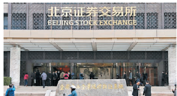
◆面對連日狂飆，北交所強調加強監管，維護市場秩序。

至於滬深三大指數昨日全線收跌。截止收市，上證綜指報3,031.7點，跌9.27點或0.3%；深圳成指報9,785.57點，跌53.95點或0.55%；創業板指報1,926.2點，跌11.74點或0.61%。兩市共成交8,288億元（人民幣，下同），北向資金淨流入3億元。房地產、醫藥、金融股領跌兩市。