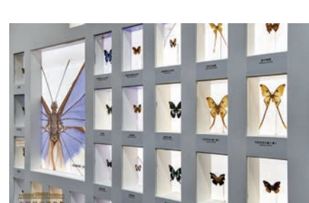
◆展覽中展示的蝴蝶標本。