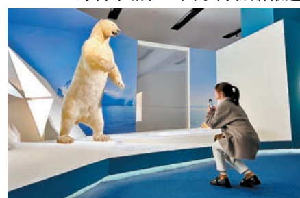
◆展覽現場，觀眾參觀北極熊標本。