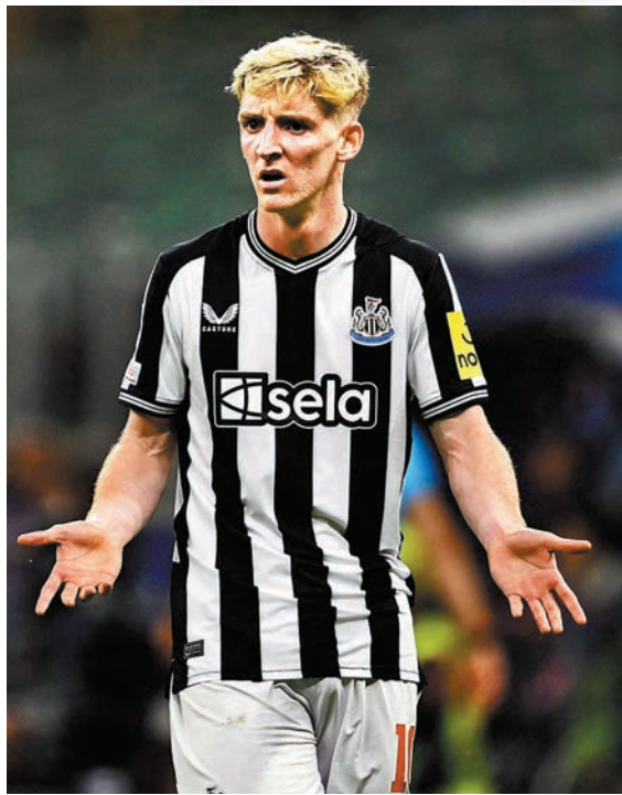
◆紐卡素射手安東尼哥頓能否幫球隊化險為夷？資料圖片