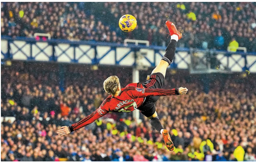
◆加拿祖射入一記精彩倒掛。