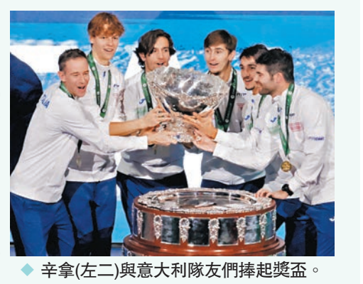
◆辛拿(左二)與意大利隊友們捧起獎盃。

2023台維斯盃男子網球團體賽決賽，當地時間26日在西班牙馬拉加舉行。在準決賽中戰勝了男單世界排名第一祖高域的名將辛拿，他領銜的意大利隊2:0擊敗澳洲隊，時隔47年再度奪冠。現世界排名第四的辛拿和排名第44位的阿納爾迪在單打比賽中分別戰勝了澳洲的德米納爾和波佩林。這也是意大利隊歷史上第二次奪得台維斯盃冠軍，上一次他們在該項賽事中奪冠還要追溯到1976年。