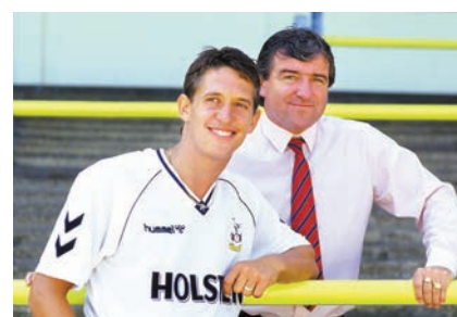
◆雲拿保斯(右)1989年將連尼加帶到熱刺。

殺入四強，最終互射12碼不敵德國。修夫基追憶雲拿保斯，讚他戰術出色和舉止態度佳，領軍時可令球員「感覺到自己的不同」。