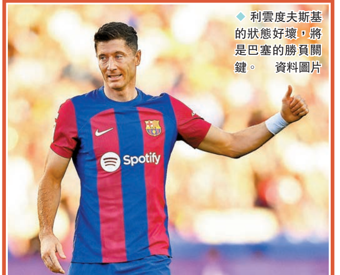
◆利雲度夫斯基的狀態好壞，將是巴塞的勝負關鍵。