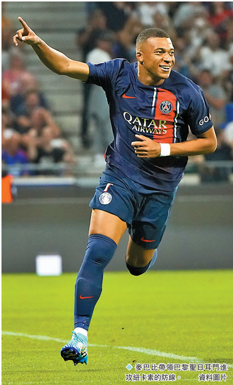
◆麥巴比帶領巴黎聖日耳門進攻紐卡素的防線。資料圖片