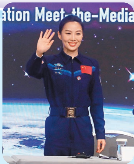
◆航天員王亞平

她平時的訓練包括穿戴120多公斤的艙外服入水、水下模擬作業7小時，這些挑戰人類生理與心理極限的訓練，王亞平一堅持就是十幾年。她說，對於航天員而言，只有飛行和準備飛行兩種狀態，在職業生涯當中，鮮花和掌聲真的是太短暫，祖國的榮譽 人民的囑託，以