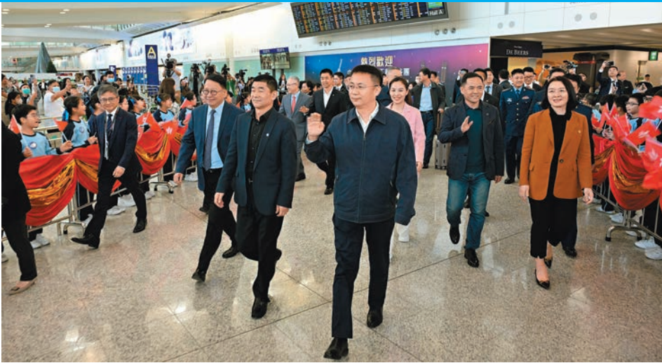
◆中國載人航天工程代表團昨日抵達香港，開啟對香港特區為期四天的訪問。圖為中國載人航天工程代表團到機場迎接的小學生致意。

照片，這是中國首次在軌獲取以地球為背景的空間站組合體全貌圖像，也是中國空間站的第一組全構型工作照，在見面會上首次對外公布。 在昨日傍晚特區政府舉行的歡迎晚宴上，代表團團長林西強將該幅中國空間站全景照片贈送予特區行政長官李家超。