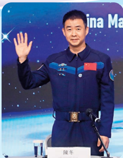
◆航天員陳冬

他分享道，在執行神舟十四號航天任務時，有不少激動人心的時刻，「當火箭點火升空時，我的飛天夢想又一次實現，我享受進入太空後的失重感，這讓我感到非常興奮。」當打開艙門進入中國空間站時，他感覺就像進入一個新的家，「這個家與地球的家不同，是飄着進去的，就算