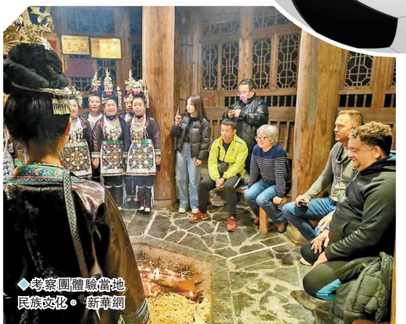
◆考察團體驗當地民族文化。新華網