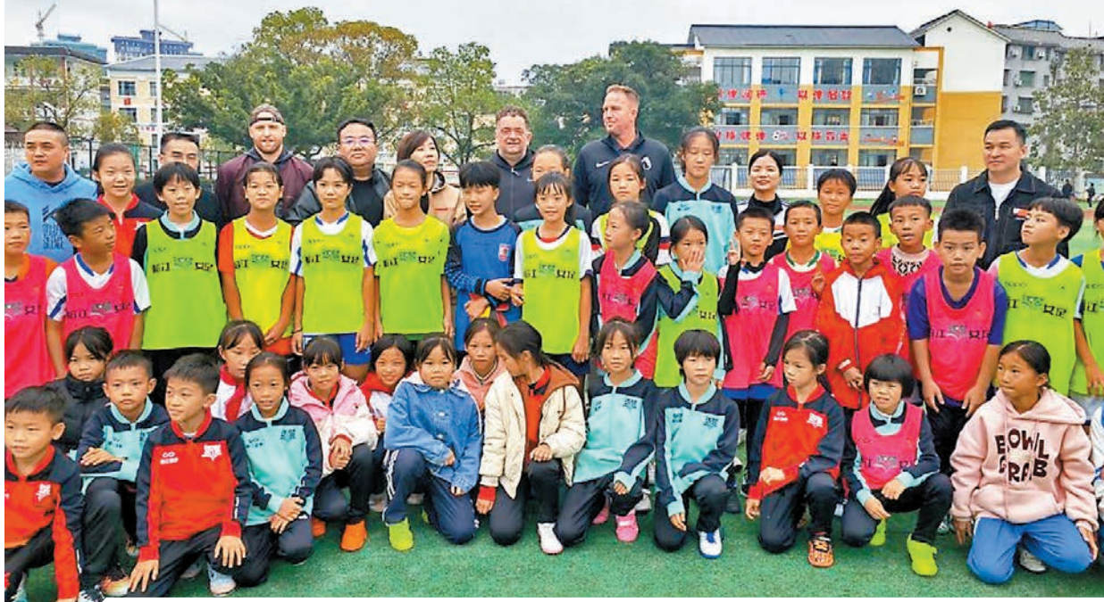
◆考察團到榕江縣古州鎮第二小學等中小學考察。

11月25日至27日，英超和英國駐華大使館文化教育處代表，遠赴「村超」舉辦地貴州省黔东南苗族侗族自治州榕江縣，進行為期3天的考察交流，旨在推進英超和「村超」之間的合作。