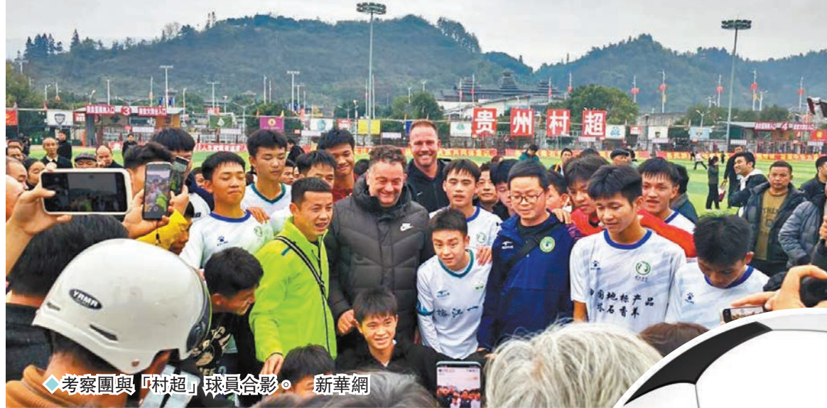
◆考察團與「村超」球員合影。

11月25日至27日，英超和英國駐華大使館文化教育處代表，遠赴「村超」舉辦地貴州省黔东南苗族侗族自治州榕江縣，進行為期3天的考察交流，旨在推進英超和「村超」之間的合作。