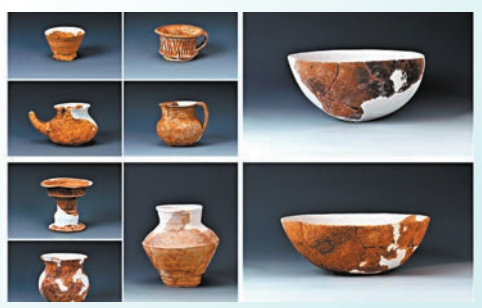
◆東花丘遺址出土的陶器。

聚落布局的變遷，生動反映了太湖地區史前社會複雜化進程，為討論長江下游區域文明發展模式提供了新視角。