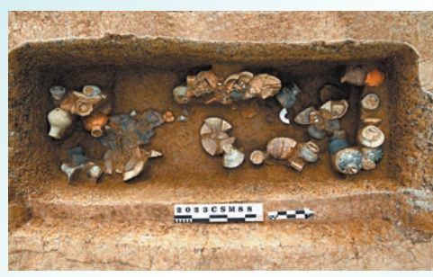
◆崧澤文化一處墓葬的俯視圖。