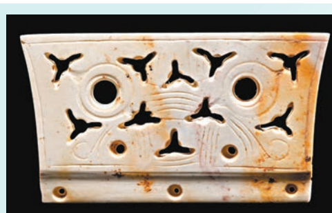
◆良渚古城及水利系統遺址出土冠狀器。

寺墩遺址是一處崧澤—良渚文化時期的中心聚落遺址，年代距今約5,500至4,500年。由內外兩重水系和多個墩、台構成，寺墩遺址自崧澤文化向良渚文化時期的文化形態、