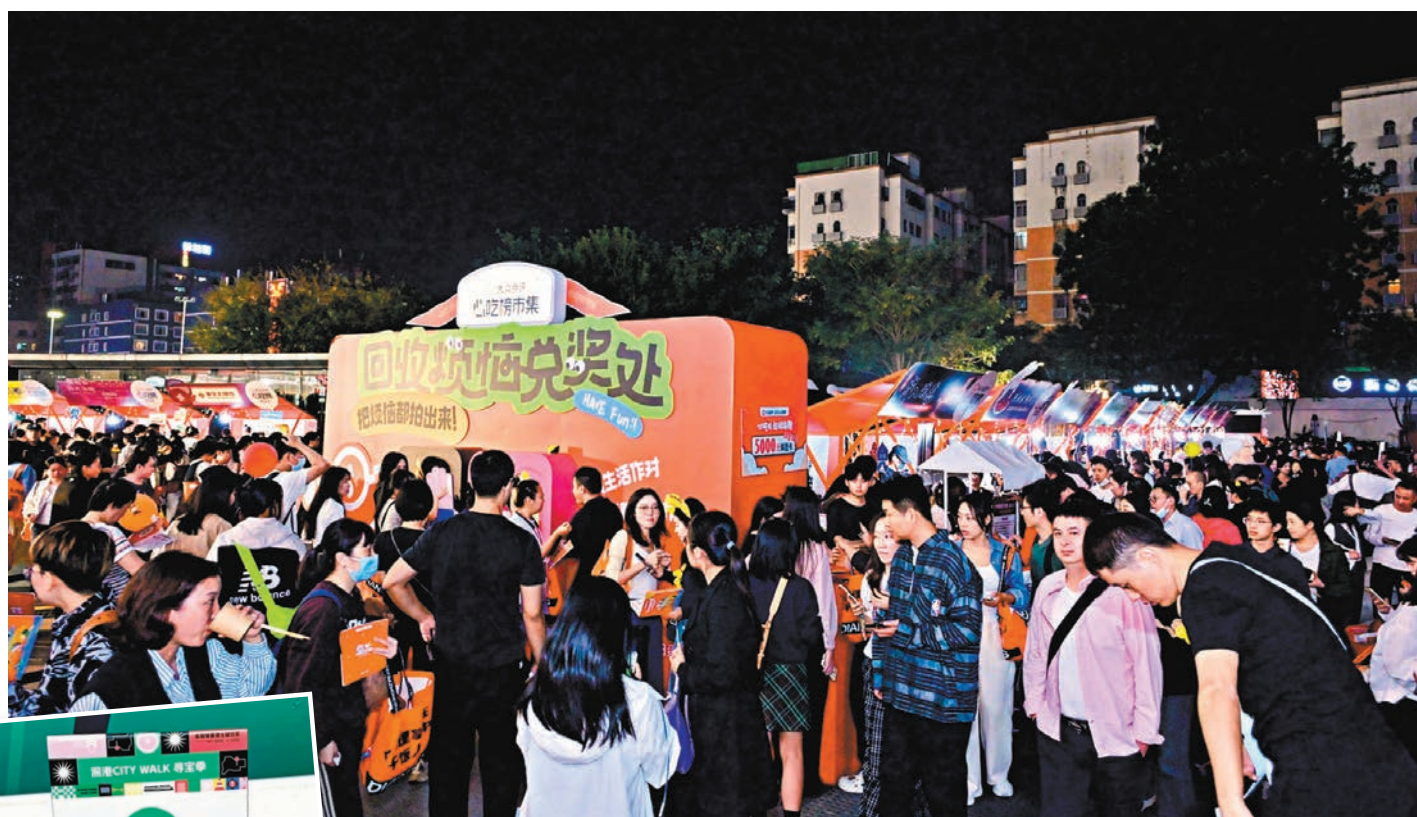
◆大灣區首屆「必吃榜市集」在深圳舉行，吸引大批客流。

「深港恢復通關後生意的確好了不少，這段時間還明顯感覺到年輕的香港客人變多了，為此還專門增加了一個美甲區域。」在福田星河 COCO Park，一家提供按摩 Spa、餐飲娛樂的生活館工作人員告訴記者，之前他們在小紅書上做了很多宣傳，請網紅來打卡分享，生意就很好。「現在用小紅書的香港人越來越多，深圳也開始發現他們喜歡通過社交平台尋找資訊的特點，有針對性地推出互動活動，希望這種雙向奔赴能一直持續下去。」