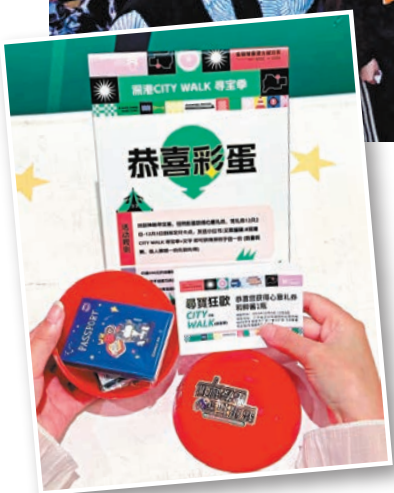
◆港青陳小姐參與分享打卡後領取的彩蛋禮品。