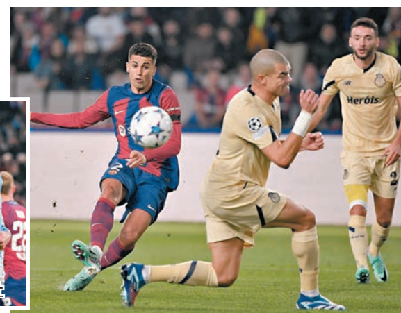
◆祖奧簡斯(左)入球瞬間。