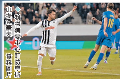
◆利物浦要小心防範寧斯。

韋斯咸與白禮頓都位列英超積分榜中游區域，前者「鎗仔軍」現時與弗賴堡同分順列A組前兩名，今仗作客對4戰得1分小組墊底的塞爾維亞球隊FK TSC，韋斯咸希望將各項賽事連勝勢頭延續到第4場，提前出線(now643台周五1:45a.m.直播)。以2勝1和1負積7分位列B組次席的白禮頓，是役出師希臘擊敗落後3分的AEK雅典，也有機會提前取淘汰賽席位(now644台周五1:45a.m.直播)。