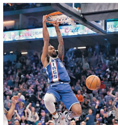
◆蒙克成為帝王今仗的贏球英雄。