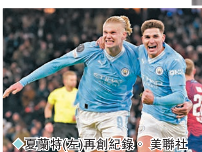
◆夏蘭特(左)再創紀錄。

至於在H組，西甲門將巴塞隆拿主場對波圖，儘管巴西前鋒比比哥沙為客隊先開紀錄，但祖奧簡斯