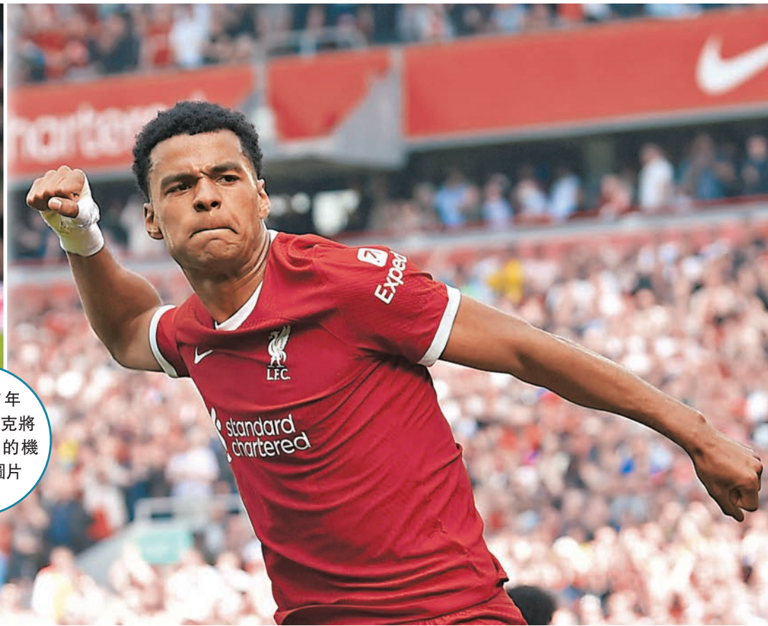
◆加普近來入球率不佳未能穩守正選，期望能夠藉盃賽來爭取表現。資料圖片

利物浦上一輪重遇首循環曾經大勝過的圖盧茲，卻爆冷以2:3敗走法國，賽後以3勝1負積9分繼續於E組領跑，比身後三支球隊圖盧茲、聖基萊斯聯及寧斯分別有2分、5分及6分優勢，因此「利記」今場只要在來訪的寧斯身上全取3分，便可奪得小組第1的直接出線權。