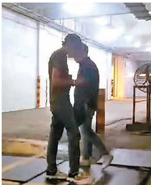
◆11月下旬某晚，涉事的南亞裔男子（左）到達觀塘偉業街一幢工業大廈後，迅速與收貨者「交貨」。