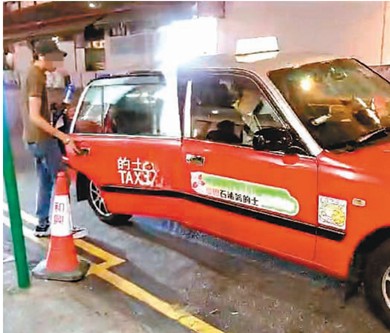
◆疑似毒品「艇仔」的南亞裔男子經常以「Call 的」方式「送貨」。

據了解，該名南亞裔男子姓Singh，29歲，在港期間同時涉嫌另一宗毒品案件。記者在追蹤調查期間，曾發現他乘港鐵前往旺角警署報到。記者日前以市民身份向警方報案，警方東區特別職務隊於11月29日晚在渣華道一帶將該名南亞裔疑犯拘捕。警方在他身上搜出少量毒品，其後在其住所內搜出300多克大麻，市值約5.5萬港元。