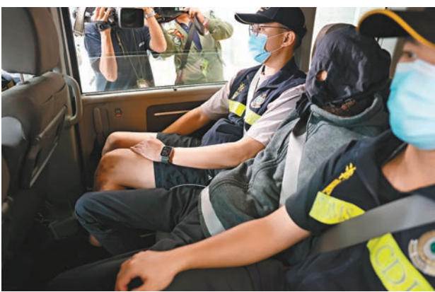
◆被海關毒品調查科拘捕的涉案疑犯。

毒品調查科高級督察唐為國昨日表示，今次案件中不幸再有未成年入被犯罪集團以微薄金錢利誘成為代罪羔羊，呼籲年輕人切勿輕信販毒集團的花言巧語、「搵快錢」或者任何原因。同時，家長要多加留意及關心子女，向他們灌輸正確價值觀，以免被毒販有機可乘。而販毒集團利用青少年販毒，將風險轉嫁到青少年身上，屬罪加一等；任何人利用青少年販毒，法庭