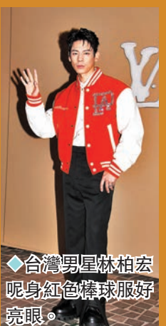
◆台灣男星林柏宏呢身紅色棒球服好靚眼。