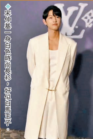
◆宋仲基一身白色時尚長衫，好似白馬王子。