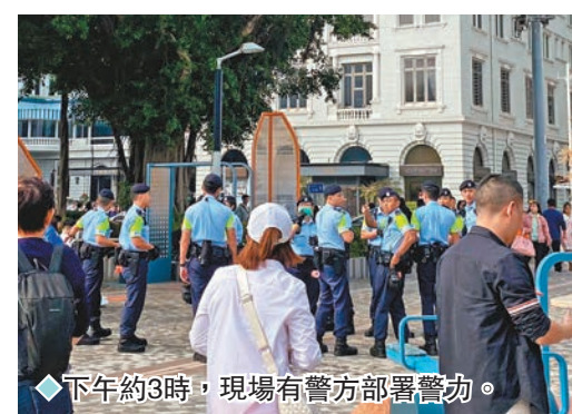
◆下午約3時，現場有警方部署警力。