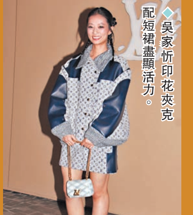
◆吳家忻印花夾克配短褲盡顯活力。