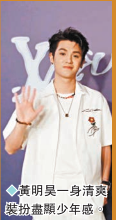
◆黃明昊一身清爽裝扮盡顯少年感。