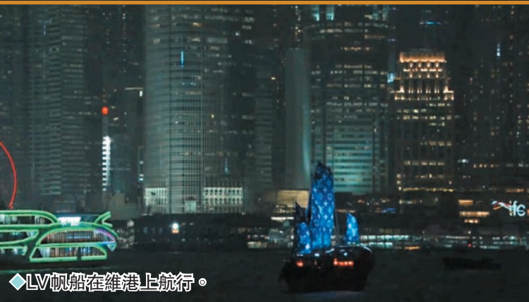
◆LV帆船在維港上航行。