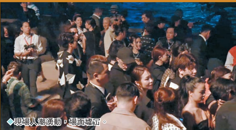
◆現場人潮湧動，場面轟動。