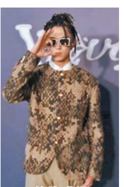
◆王鶴棣靚騷造型登場。