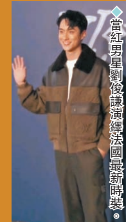
◆當紅男星劉俊謙演繹法國最新時裝。

香港文匯報訊（記者 梁靜儀、吳文釗）國際品牌 Louis Vuitton (LV) 2024 初秋男裝系列時裝騷，昨晚於尖沙咀星光大道舉行，雲集80位中外名人紅星行騷，示範最新款時裝。