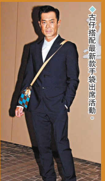
◆古仔搭配最新款手袋出席活動。