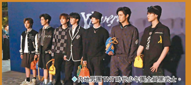
◆內地男團TNT時代少年團全員黑武士。