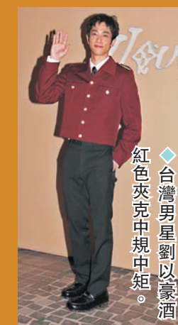
◆台灣男星劉以豪酒紅色夾克中規中矩。