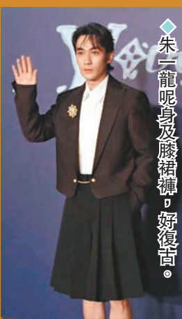
◆朱一龍呢身皮褸褲褲，好復貴。