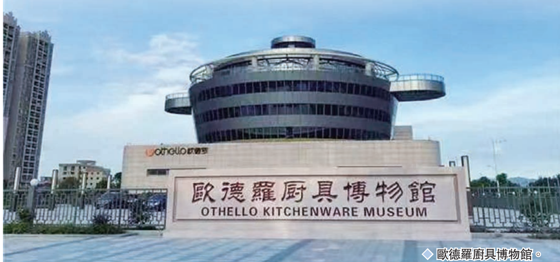
◆歐德羅廚具博物館。

新興不銹鋼企業還加大力度開拓貿易新形態，緊握直播電商、跨境電商的浪潮，擴大「新興智造」產品「出海」渠道；此外，新興不銹鋼龍頭企業萬事泰集團建成歐德羅廚具博物館，融合「工業+旅遊」發展新模式，開發和建設優質的營銷渠道，提升市場品牌形象和銷售份額，打造外貿競爭的「新勢力」。把握新機遇，搶灘新市場，新興不銹鋼餐廚具行業乘風揚帆，未來可期！