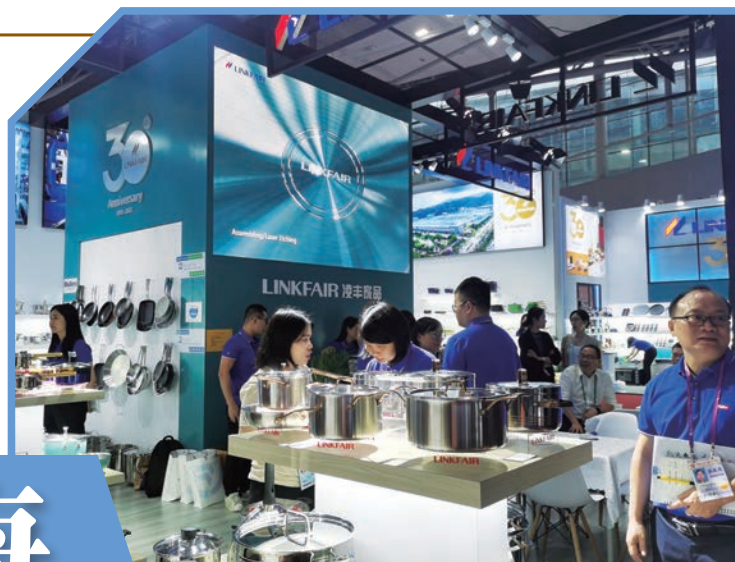
◆新興縣不銹鋼參加第134屆廣交會。

1984年，新興縣一家農機廠和港商合作，以「三來一補」的方式，合資在廠內設一生產車間，生產一些簡單的不銹鋼製品用作出口外銷，開啓了雲浮新興一段不銹鋼產業快速發展的傳奇。經過近40年時間的發展，不銹鋼餐廚具產業作為新興縣的特色產業，一邊加快推動不銹鋼餐廚具、鋁製品、先進裝備製造三大百億產業集群和雲浮市打造千億級金屬製造產業集群建設，一邊主動搶抓RCEP新機遇，積極利用平台的渠道、信息、研究等優勢，優化產業在RCEP成員國的進出口布局，奮力在RCEP的「新賽道」上再創新輝煌。