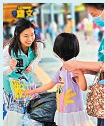
◆羅文笑臉迎小朋友。