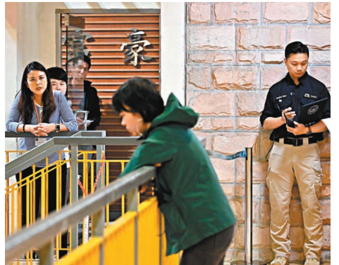
◆15名來自警隊不同部門的新學員已完成兩周的「危機談判」課程。圖為學員模擬攔阻在行人天橋上企圖自殺人士。

香港文匯報訊（記者 蕭景源）警務處警察談判組今年招募15名來自警隊不同部門的新學員，於昨日完成兩周的「危機談判」課程。訓練因時制宜，加入了不同情景下的應對能力及談判技巧，包括解除校園危機。今年首10個月，談判組已處置70宗「有人在危險位置」、「有人被困」及「企圖自殺」案件，當中69宗的事主被成功勸服及被帶回安全位置。