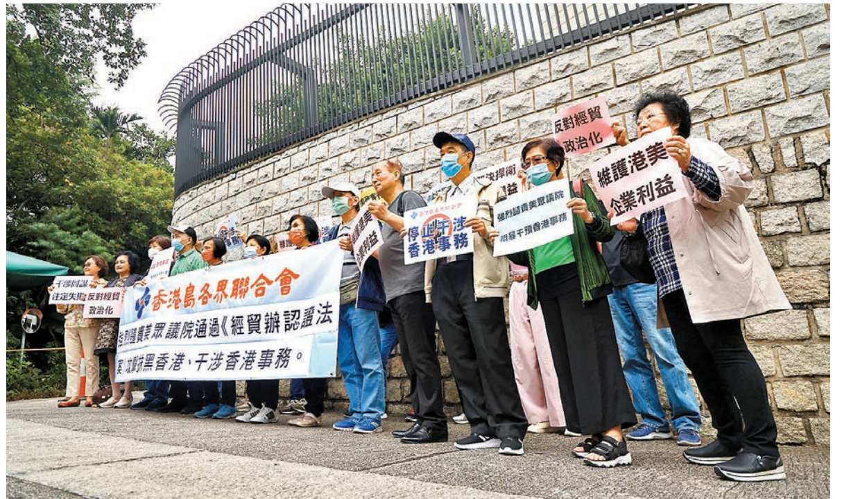
◆有市民昨日到美國駐港總領事館抗議，譴責美國眾議院外交事務委員會通過所謂的《香港經濟貿易辦事處認證法案》，干預香港事務。

「保衛香港運動」昨日到美領館外舉行「強烈譴責美國惡搞認證經貿辦」集會，約十多名出席市民