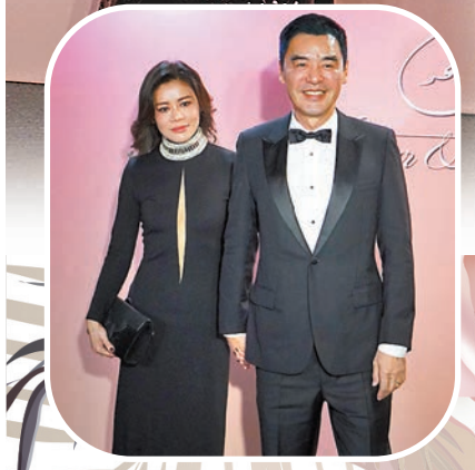
鍾鎮濤與性感打扮的太太拖手現身。