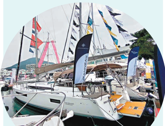
◆帆船Jeanneau Sun Odyssey 490總長48.6呎(約14.8米)，其售價約49萬歐羅。