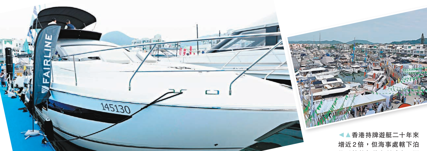
◆香港持牌遊艇二十年來增近2倍，但海事處轄下泊位反較廿年前有所減少至不足2,000個。

他指出，遊艇業為香港帶來的經濟效益，除了賣船的直接收益外，亦涉及運輸、保險、機器檢查維修、船底保養上漆、船隻清潔、船長水手等經濟活動，正如汽車業一樣牽涉龐大的上中下游產業鏈，船廠和遊艇會亦可從中獲得商機。