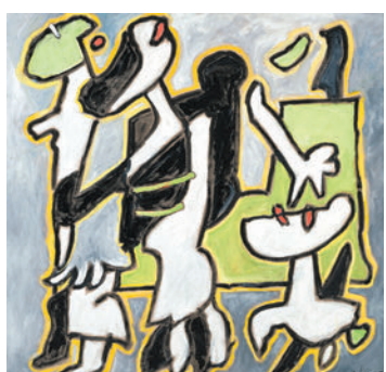
◆《思源》，一九七六年，油彩布本

「探本尋源」以維加斯詩作《歸來，從那夜》當中一句為標題，呈現藝術家的創作歷程：從對前哥倫布時期和古非洲文化神話宇宙的體悟，到十二年的巴黎轉型時期，及至回歸委內瑞拉後，他無拘無束地在抽象與具象之間遊走，但始終扎根於他的拉丁美洲文化身份。展覽呈現藝術家如何在委內瑞拉以及全球的急速現代化當中追尋文化根源，彰顯他的創作信念：藝術讓我們返回人性的源頭以求更新。