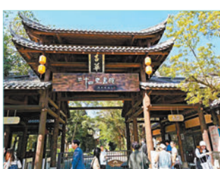
◆甘坑古鎮的二十四史書院