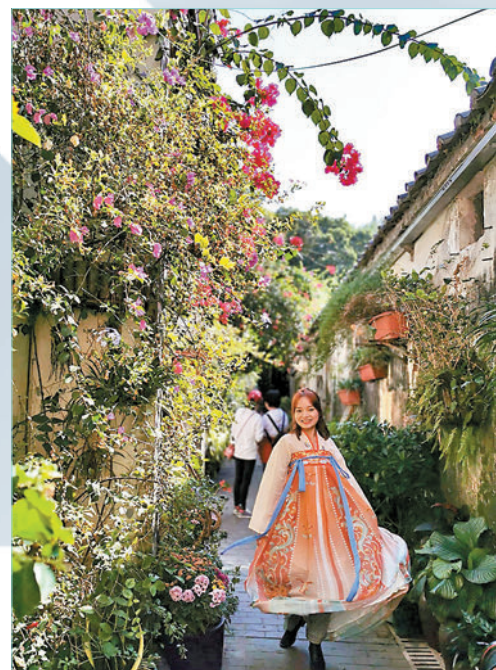
◆網紅租華服在龍崗甘坑古鎮穿越古代。

日前，2023「潮嘆龍崗」深港台潮創樂享周，在深圳市龍崗區舉行了文旅龍崗專線打卡活動，以及港風潮流音樂會專場。來自深圳和香港的藝術名家及網絡達人齊聚一堂，透過交流加深各地文化聯結。甘坑古鎮、大芬油畫村、龍城CC文創街區等地，皆以新穎形式展現傳統古樸風範與中華精神。「潮嘆龍崗」深港台潮創樂享周包括有網紅文化交流團考察活動、集市及在萬達廣場舉行的音樂會。深圳市龍崗區港澳事務局局長劉德平表示，龍崗區是深圳市第二大區，國際級的科技公司落戶龍崗，還有三所高等院校均位於龍城街道深圳國際大學園，體育館深圳大運中心，甘坑古鎮、玫瑰海岸、西涌等旅遊資源，這都鼓勵了各地年輕人到龍崗遊覽、探索、發展。 文：雨竹