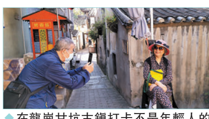
◆在龍崗甘坑古鎮打卡不是年輕人的專利。