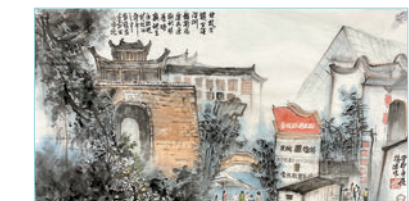
◆香港著名畫家陳偉老師筆下的深圳龍崗甘坑古鎮。