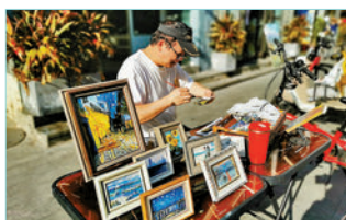
◆大芬油畫村有不少畫家都跟上時代步伐走出畫室。