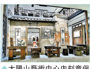
◆太陽山藝術中心內刻意保留的建築遺址。