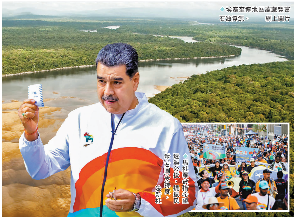
◆埃塞奎博地區蘊藏豐富石油資源。