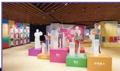
◆ 領展可持續未來館推出全新主題，與公眾一起探討社會共融課題。