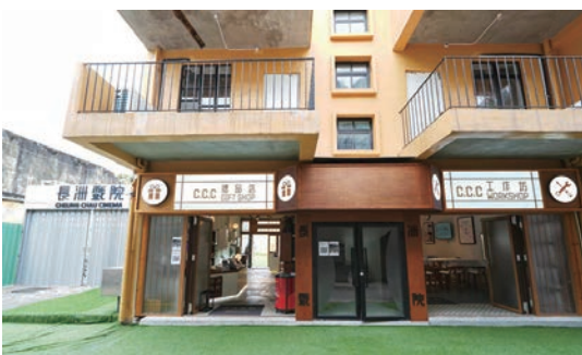
◆ 長洲戲院是香港一個富有活化歷史的保育項目。

長洲戲院作為長洲地標式歷史建築，經活化工程後，搖身一變成為最新藝文生活空間，揉合創意培育、文化藝術、保育及體驗式學習於一身。今年 12 月，長洲戲院將聯同香港中華文化活動推廣協會合辦為期三星期「長洲戲院·中華文化節 2023」，讓大家可以從多面向了解、體驗及欣賞中華文化。期間，將設置重點展覽、表演、工作坊及講座，藉此弘揚中華文化新氣象。