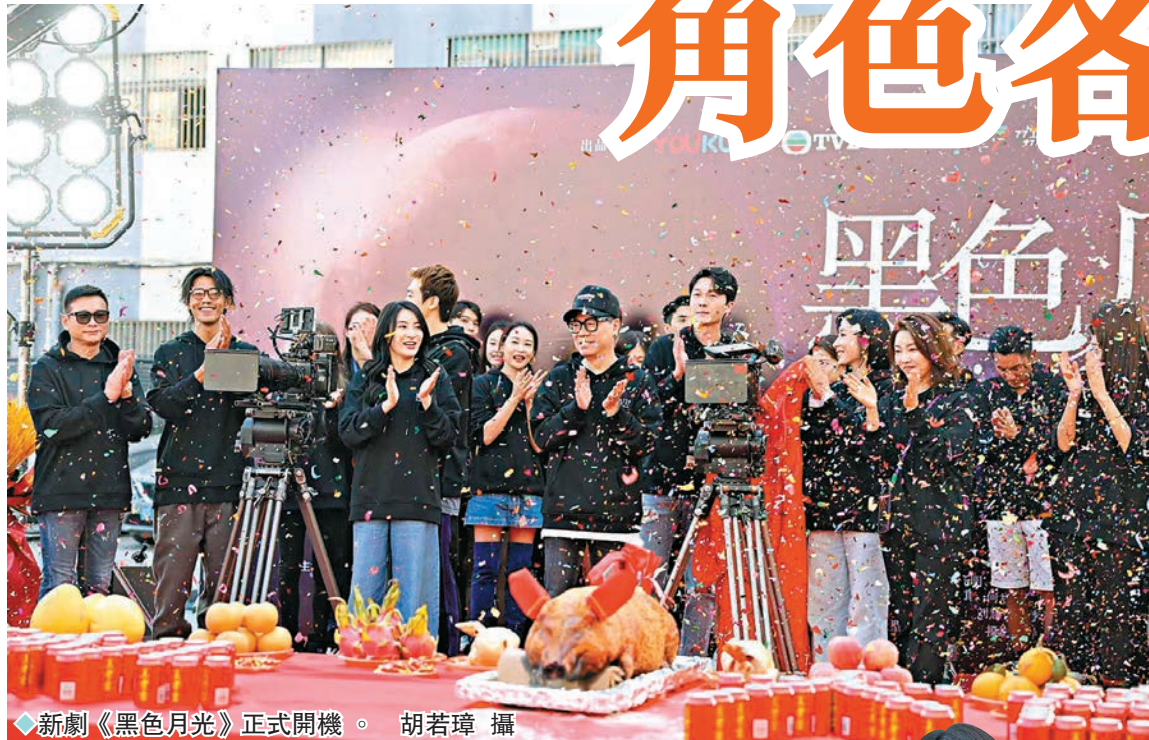
◆新劇《黑色月光》正式開機。胡若璋攝