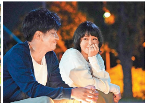
◆電影充滿感人故事，窩心又溫暖。

受到哪怕是微不足道的生活的希望，讓他們感到有人在陪伴着他們，緊緊地依偎在一起，這是我一直製作電影的初衷。希望年輕人看完《橙油燈》後，能夠產生一種『這個世界是值得珍惜的』，『應該是這個樣子的』這種心情。希望能夠引起這種情感，然後希望能夠傳達出『與認知症共同生活』是什麼樣的體驗。」