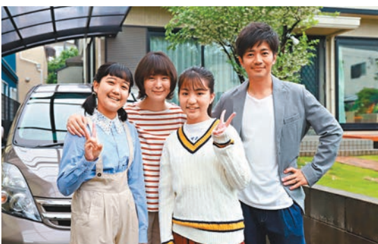
◆該片根據真人真事改編，故事勵志。