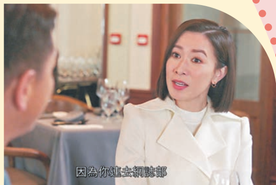
阿佘寸爆馬明就連網誌部阿頭都有資格做。

版神經質。我做功課時有留意到神經質嘅除咗面部肌肉偶爾會抖動，通常都唔係好敢直視人，會好迴避，但有時又想演但又唔想太有表演痕跡就好。」