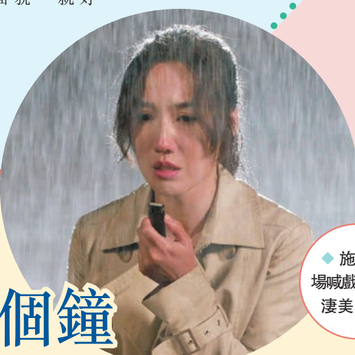
施燐妮場喊戲喊得好淒美。