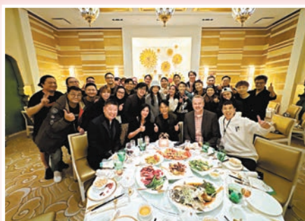
眾人為李克勤慶生。