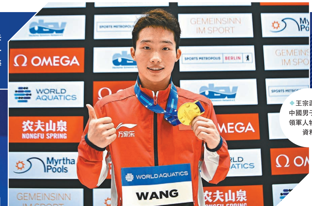
◆王宗源已是中國男子跳板領軍人物。

在2023年，王宗源接連出戰3站世界盃、世錦賽和亞運會，且均告捷，已是當之無愧的中國男子跳板領軍人物。從謝思場、曹緣到龍道一，東京奧運會以來，王宗源的男雙3米板搭檔已更換過多位，他在雙人項目中的角色也歷經變化。「以前是老大帶着我比賽，向我傳授比賽時如何調整心態、應對臨場變化。現在我也會跟隊友分享自己的心得和經驗，以及前輩們告訴我的一些東西。這或許就是傳承吧。」王宗源說。