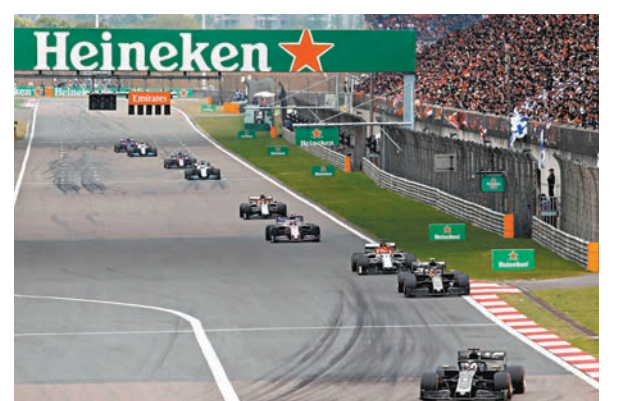
◆F1中國站於明年再次舉辦。