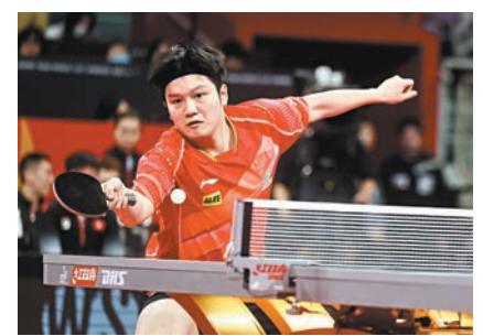
◆樊振東表現穩健。資料圖片

香港文匯報訊(記者楊浩然)2023年成都國際乒聯混合團體世界盃昨晚上演第二階段首輪比賽，結果國乒在樊振東等帶領下輕鬆以8:1擊敗對手取得勝利；其餘戰果方面，日本以8:0擊敗中國台北；韓國則以8:5擊敗法國。