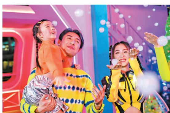
◆今年聖誕節西餐廳訂座率只得兩三成，比去年遜色。圖為海港城的聖誕裝飾吸引親子同樂。

香港文匯報訊（記者 張弦）聖誕節是餐飲業的旺季之一，不少香港市民都會在聖誕節前後與親友外出吃聖誕大餐。香港文匯報記者在查詢後了解到，今年多間西餐廳推出的聖誕大餐人均收費介乎128元至5,088元不等。有餐飲業界人士表示，本月初只有約兩三成客人提前預訂聖誕套餐，遠不及疫情前同期八九成訂座率，估計今年市道或遜過去年，又擔心出境人數比入境人數多，北上消費及外出旅遊帶來的競爭大，建議特區政府考慮如何吸引更多港人在港消費。