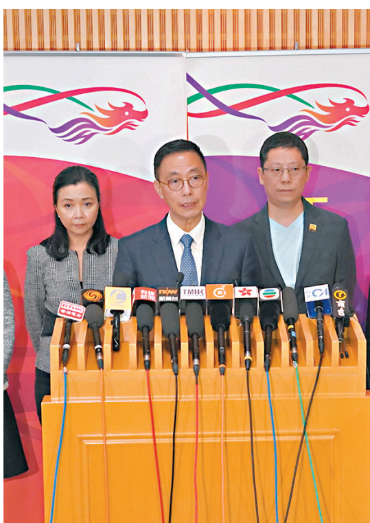
◆楊潤雄（中）邀請餐飲、零售、商場、交通等界別人士討論如何推動本地消費。

在大型活動方面，楊潤雄表示，香港是不少國際巨星及時裝秀的熱門舉行地點，中環海旁、紅磡體育館和香港文化中心等主要場館，檔期大致爆滿，長遠有需要建設更多表演場地，以吸引不同盛事、演唱會和表演來港舉行。早前，國際時裝品牌Louis Vuitton在尖沙咀星光大道舉行時裝秀，就吸引大批明星和本地名人參與，他留意到有相關的影片瀏覽次數逾1億次，相信可告訴世界：香港有能力舉辦大型活動，歡迎外國人親身訪港一賞維多利亞港和消費，有助帶動旅遊業。