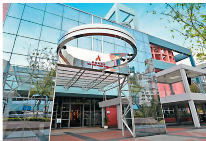
◆尖東香港科學館擬遷往沙田文化博物館。

他強調，特區政府今次只是收集意見，並非要求立法會議員在短時間內就專館的內容和位置作決定。當完成全港博物館整體布局的研究及收集意見後，局方將於明年中就博物館整體規劃和布局提交文件諮詢立法會。