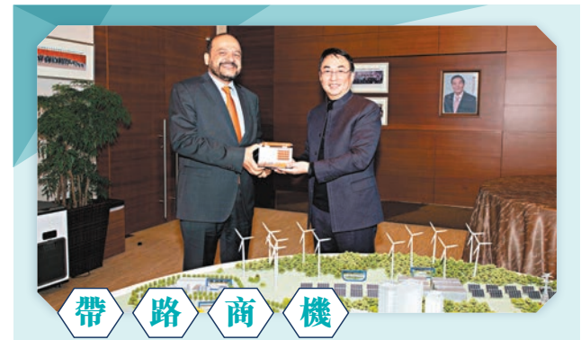
恒基地產及香港中華煤氣主席李家傑在香港會見到訪的全球最大石油化工企業Saudi Aramco（沙特阿拉伯國家石油公司沙特阿美）執行副總裁（科技及創新）Ahmad O. Al-Khwaiter，就氢能、儲能等新能源領域的合作進行深入交流。是次交流，充分配合中國「一帶一路」倡議，並推動香港特區政府碳中和及向全球招商引資政策，相信綜合三方實力，可充分發揮各自優勢，推動綠色能源領域發展。

從業態方面看，超市/小超市和雜貨店的銷售額今年首三季分別實現3%和6%的同比增長。電商同比增長4%，表現優於整體快速消費品市場。快手、抖音等興趣電商市場份額比去年同期提高6個百分點以上。得益於購物者數量的增加和購物頻率的提高，大賣場業態中的倉儲會員店實現58%的強勁增長。