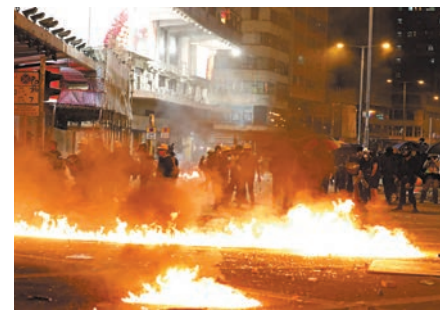
◆2019年11月18日，大批暴徒在油尖旺一帶掀起。資料圖片

嚴官判刑時引述同一事件另外兩案指，法官練錦鴻以判囚24個月為量刑起點，而法官李俊文則以6個月為量刑起點。兩案起點差距大的原因是，李俊文認為即使當時正值理大衝突，沒證據