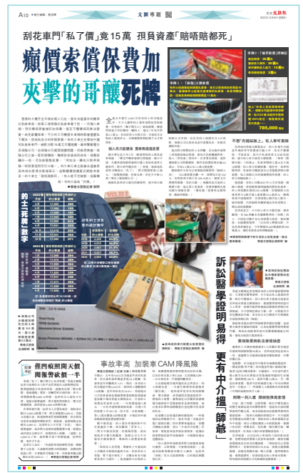
◆香港文匯報昨日報道，的士第三者保險費竟為私家車十倍。香港文匯報PDF版面