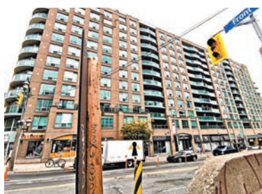
◆加拿大住屋供不應求，國際學生被指導致情況惡化。