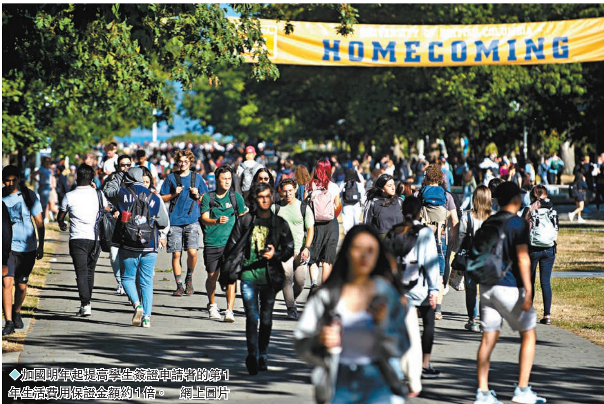
◆加國明年起提高學生簽證申請者的第1年生活費用保證金額約1倍。網上圖片