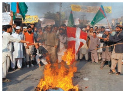
◆伊斯蘭教信徒焚燒丹麥國旗抗議褻瀆《可蘭經》。 網上圖片

今年丹麥和瑞典發生了多宗焚燒和褻瀆《可蘭經》的示威事件。當時由於憲法保護言論自由，兩國政府對這種行為都只能譴責卻不能制止。事件在伊斯蘭教界引起強烈憤怒和抗議，數百名抗議者7月衝進位於伊拉克巴格達的瑞典大使館，翻越使館圍牆並縱火示威，抗議者也一度試圖衝進丹麥大使館。