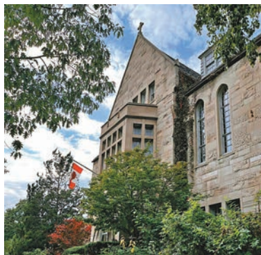
◆多倫多大學收錄不少國際學生。

民調顯示大多數加拿大人認為全國各地正面對住房危機，政府應限制移民和國際學生人數，可防止危機惡化。聯邦政府指出，申請簽證的國際學生必須出示「經濟支持證明」，確定他們能夠在加拿大養活自己。國際學生聯合會發言人羅浩批評聯邦政府把國際學生的生活費保證金提高一倍，顯然是排斥來自世界各地的基層學生。羅浩認為準備在明年1月申請簽證的基層國際學生，實在很難在短時間內尋找增收的生活費保證金。