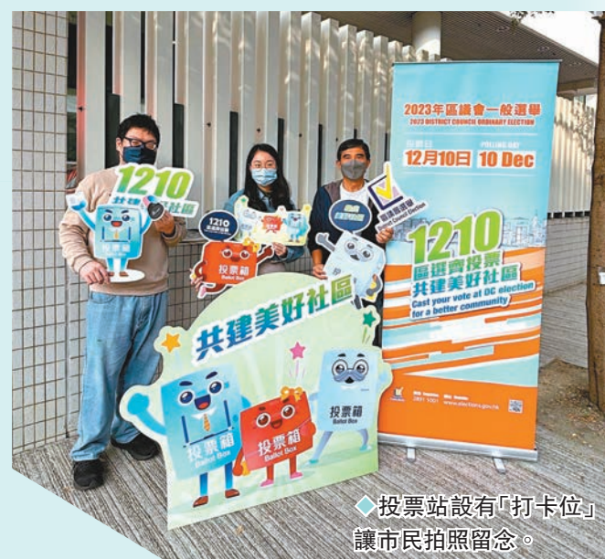
◆投票站設有「打卡位」讓市民拍照留念。