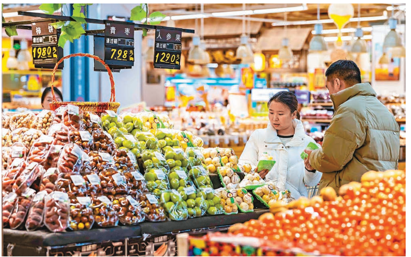
◆國家統計局數據顯示，從同比看，由於去年同期基數走低，鮮菜價格由10月下降3.8%轉為上漲0.6%。圖為12月9日，消費者在貴州省安順市西秀區一家超市選購水果。

王青預計，今年12月CPI同比轉正難度較大，不過，伴隨「豬周期」逐步走出底部，居民消費進一步修復，2024年CPI同比中樞有望從今年0.4%的低位，逐步回升至1.3%左右，通縮風險會進一步弱化。