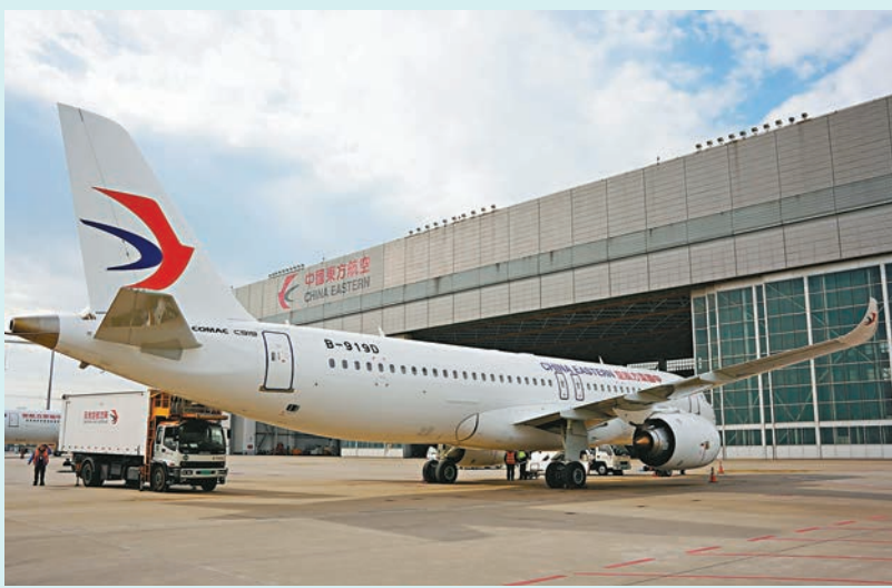
◆東航接收的第三架C919大型客機。

2023年7月16日，東航接收第二架C919客機，並從8月4日起與首架機「搭檔」執