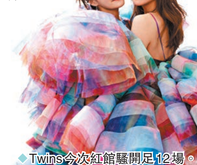
Twins今次紅館騷開足12場。

此外，最近又有不法之徒，於社交網上開post，指Twins演唱會招聘保安、檢票員等職位，演唱會總監馮貽柏表示，從來沒有進行過任何職位的招聘，勸喻歌迷千萬不要受騙，把自己的個人資料或電話等給予這些網站，小心保障個人利益。