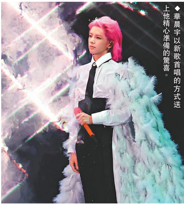
華晨宇以新歌首唱的方式送上他精心準備的驚喜。