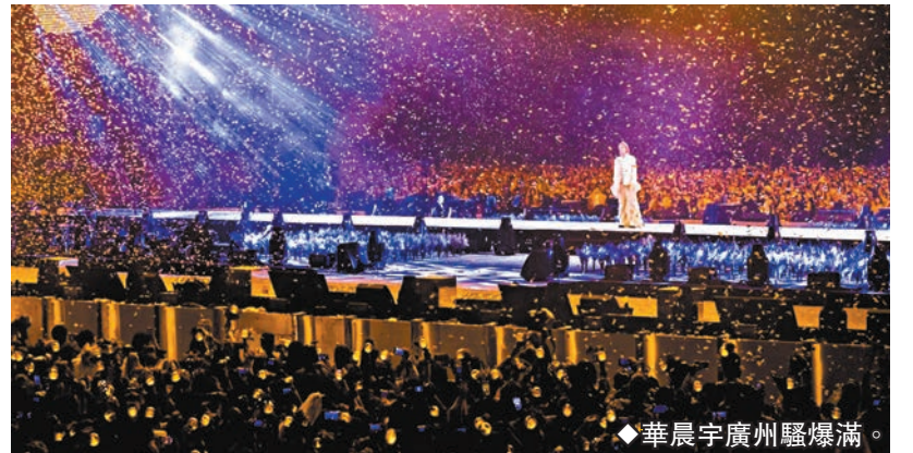
華晨宇廣州騷爆滿。