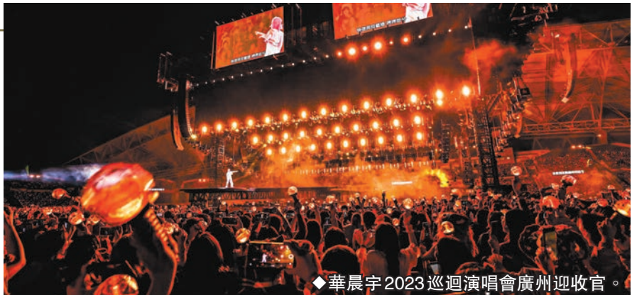
華晨宇2023巡迴演唱會廣州迎收官。