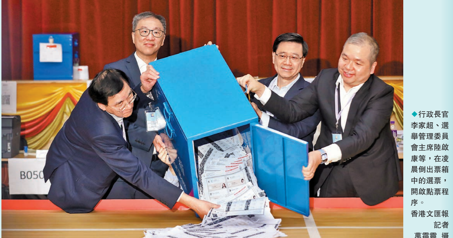
◆行政長官李家超、選舉管理委員會主席陸啟康等，在凌晨展開出票箱中的選票，開啟點票程序。

他說，這次選舉其中一項重點工作是確保選舉投票和點票過程高效進行，是次故障令工作和原先預期有落差。自己對今次系統故障高度關注，已要求選管會成立專責調查小組，邀請有經驗者全力調查是次事件，找出問題成因，確保同類事件不會再發生，並在選舉完成後的3個月向他提交的報告中，詳細就系統故障的調查結果做匯報。 李家超表示，選管會主席同意他的想法，成立專責調查小組，小組由文大立資深大律師領導，成員包括政府資訊科技總監辦公室、警方網罪科等共同調查。