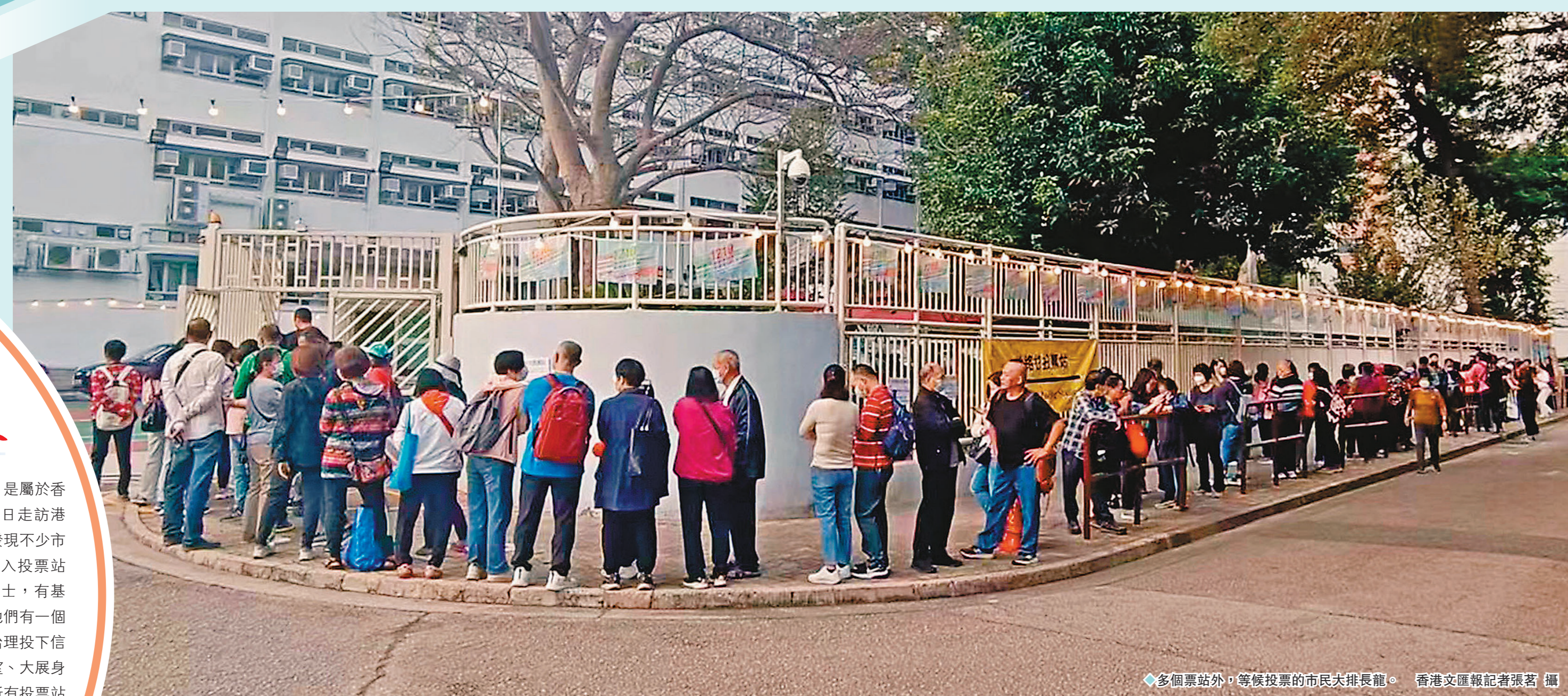
◆多個票站外，等候投票的市民大排長龍。