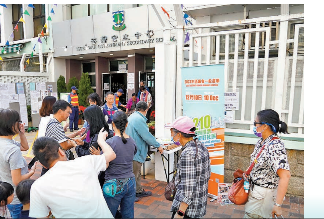
◆在全港多個票站，前往投票的選民人頭湧湧。

居於元朗逾30年的少數族裔人士Khan認為，區選是一項體現民主的活動，作為當區居民，參與投票是公民權利的體現，自己不想錯過這個機會。「我沒有把自己看成少數族裔，我在香港居住這麼多年，我覺得我們大家都是平等的市民，我希望選出可以幫助地區的候選人。」 Khan坦言，他不看重候選人的政團背景，主要是看他們提出的政綱，最希望解決區內的交通、綠化，以及基層福祉問題。