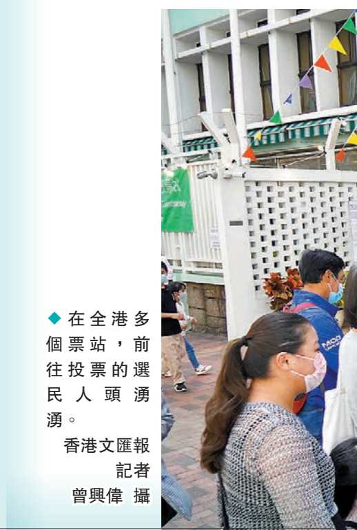
◆在全港多個票站，前往投票的選民人頭湧湧。

年逾70的陳先生多年來每屆選舉都會履行選民責任去投票，他覺得今年的選舉氛圍特別和諧，少了候選人互相抨擊的情況，大家都開始真正關注在社區、民生議題上。 他又留意到特區政府和候選人也都積極地參與區議會投票的宣傳活動，所有候選人的競選理念和政策都得到充分地傳播，「我在社區見過所有候選人親自宣傳，投票和競選氣氛都非常熱烈和融洽，所以我也很有意去投票。」 居住在油尖旺區逾十年的鄭先生，在九龍公園體育館下選票後表示，每一屆區議會選舉投票他都沒有缺席，「這是作為香港公民的責任，雖然一個人的力量很微薄，但都會盡公民責任，我亦都呼籲身邊的親朋好友一齊投票。」他表示，對新一屆區議會充滿期待，「這是香港新選舉制度後的第一次區議會選舉，相信會做更多實事。」 上午8時32分，九龍公園體育館內投票站的首位投票市民梁先生向香港文匯報記者分享激動心情，原來這是他第二次在區議會選舉中投票，第一次是在2019年的區議會選舉，「我很有意當當時一些人在黑暴期間的行為，所以我登記做選民，我一定要出來投票支持政府，這次也是表達支持，一定要出來投票支持『愛國者治港』、支持愛國愛港的區議員。」 坐著輪椅的王女士很早就到達投票站，她來到九龍公園投票站的路程並不容易，但她直言作為香港市民，只要是對香港有益的事