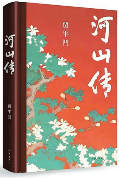
▲賈平凹第20部長篇小說《河山傳》正式出版。

2020年9月出版發行《暫坐》和《醬豆》之後，這一次賈平凹又將筆端聚焦於都市生活中的人情冷暖。《河山傳》中的主人公是陝北來西安打工的農民洗河，他在輾轉漂泊中邂逅了民營老闆羅山，從此演繹出一段段小人物與大世界之間發人深省的故事。