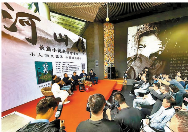
◆於西安建築科技大學賈平凹文學藝術館舉行的《河山傳》新作分享會。