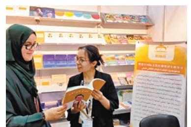
◆《鍾南山：蒼生在上》阿拉伯文版亮相沙迦國際書展。

香港文匯報訊（記者李望賢深圳報導）近日，《鍾南山：蒼生在上》阿拉伯文版由智慧宮聯合花城出版社及埃及賽福薩法出版社共同翻譯、出版，並亮相第42屆沙迦國際書展，正式與海外讀者見面。