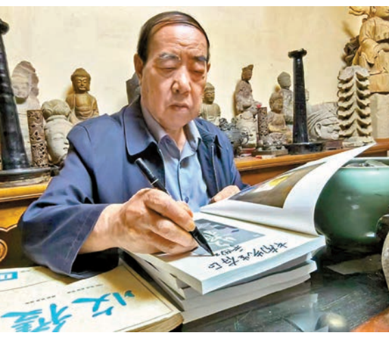
▲賈平凹為讀者簽名。