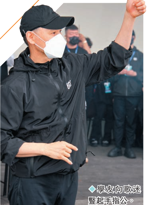
◆學友向歌迷豎起手指公。