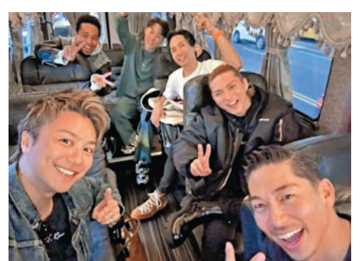
◆AKIRA(前排右)與隊友開心留影。

香港文匯報訊 日本唱跳男團EXILE前晚在台北流行音樂中心開唱。EXILE成員AKIRA在2019年與台灣名模林志玲結婚，林志玲前晚當然也現身相挺，她特別穿上演唱會T-shirt現身，還開心揮舞演唱會毛巾和小旗子高喊「加油」，為老公打氣。 而在表演途中還一度碰到音響出現問題導致音樂停止，團員們笑說：「太高了，所以音樂停了，沒想到第一次在台灣公演就停了，會成為回憶吧，我們永遠不會忘記，那就再跳一次吧。」AKIRA也展現語言能力，用中文向粉絲喊話，還邀請團員自我介紹。