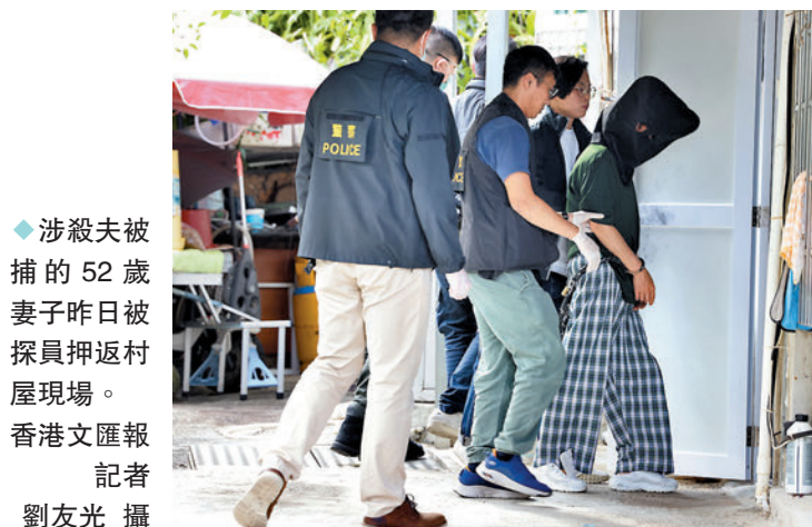
◆涉殺夫被捕的52歲妻子昨日被探員押返村屋現場。

香港文匯報訊（記者 蕭景源）大埔寨四村上星期六（9日）揭發的殺夫案，警方昨日下午將涉嫌謀殺親夫的妻子押回案發村屋重組案情，其間搬來白膠板等道具模擬床板架、床褥及被鋪，重組煽殺死者經過，並由探員用攝錄機拍下整個過程。案情重組約兩小時完成，探員再將涉案妻子押上車離開，晚上落案控告她一項謀殺罪，今日（12日）上午在粉嶺裁判法院提堂。