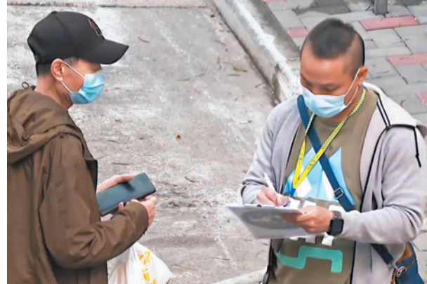
◆警方昨日展開全港性執法行動，向亂過馬路者進行票控。資料圖片

香港文匯報訊（記者 蕭景源）今年本港致命交通意外有上升趨勢，警方繼早前在全港約百個人流多的地點進行一輪宣傳教育、提醒市民過馬路的安全意識後，由昨日起展開全港執法行動，包括調配便裝人員參與，一旦發現市民胡亂過馬路，會不予警告即時作出票控，其間更會有交通警員在附近監視和拍攝。