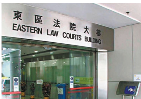
◆東區裁判法院。

廉署在新聞稿中表示，廉署經調查後發現，女被告涉嫌在2023年區議會選舉期間，在網上社交平台專頁轉載的一則杯葛2023年區議會選舉的帖文。該帖文由2021年拒絕宣誓被DQ的前深水埗區議員李文浩，在今次選舉期間於其個人社交媒體專頁發布，其中鼓吹他人杯葛區議會選舉。女被告還涉嫌在該則被轉載的帖文加上文字說明，煽惑他人在選票上填寫姓名及身份證號碼，令選票無效。