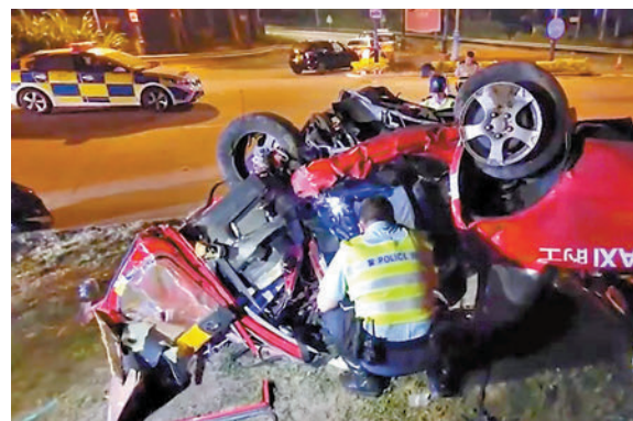
◆車禍中，肇事的士撞至「四輪朝天」嚴重損毀，重傷被困司機由消防員救出送院不治。資料圖片

香港文匯報訊（記者 蕭景源）大嶼山竹篙灣公路近神奇道迴旋處昨日凌晨發生致命車禍。一名每逢周日兼職做的士司機努力賺錢的年輕工程師，凌晨駕一輛全載的士途中，的士失控上迴旋處草坪撞毀路牌，繼而猛撼花槽石牆後翻轉四輪朝天，整車頓告嚴重毀爛，儼如廢鐵。工程師當場重傷昏迷被困，由消防員救出送院搶救，惜最終證實不治。