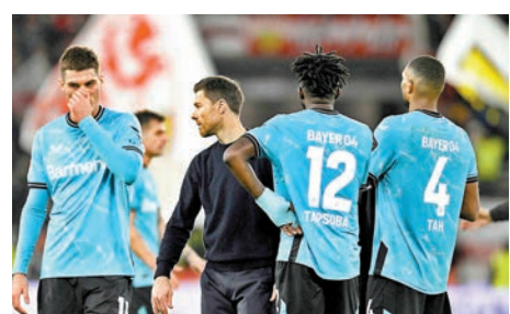
◆利華古遜痛失兩分。

德甲「一哥」利華古遜於當地時間周日登場，結果球隊上半場被史特加中場基斯富列治先開紀錄下，僅能於下半場憑利安華迪斯入波，主場以1:1賽和對手，賽後14戰得36分，僅4分領先少賽一場的拜仁，未能藉後者於本周不敵法蘭克福，大幅增加領先優勢。 ◆綜合外電