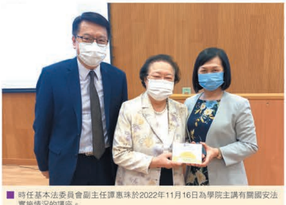
時任基本法委員會副主任譚惠珠於2022年11月16日為學院主講有關國安法實施情況的講座。

東華學院亦邀請資深政界人士主講學院講座，向學生分享國安教育的重要性。講者包括前立法會主席曾鈺成及時任基本法委員會副主任譚惠珠，他們分別主講以「與香港青年談國家安全及國家發展」及「一國兩制與港區國安法的實施情況」為題的學院講座。