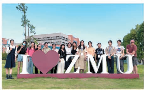
東華學院學生參觀遵義醫科大學的校園。

此外，護理學院學生亦於今年暑假參加了遵義醫科大學舉辦的「知行貴州」絲綢之路青年交流計劃「醫路有你，伴我同行」——東盟醫學夏令營，與來自俄羅斯、馬來西亞、泰國等地的師生，透過實地考察、參觀學習、貴州醫學特色課程教學等，體驗中國傳統文化，了解貴州特色草藥以及貴州醫學的發展。