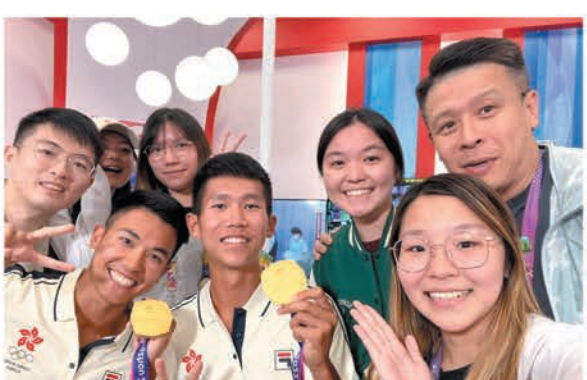
東華學院三位學生獲挑選擔任杭州亞運會主媒體中心的義務工作人員。

此外，學院團隊於9月前往惠州考察，拜訪了市教育局及市外事局局長游小慧，並與惠州衛生職業技術學院及惠州開放大學簽署合作框架協議，促進兩地優勢互補；同時，團隊亦參觀廣州中醫藥大學惠州醫院、惠州仲愷高新技術產業開發區等，了解惠州市在醫療及高新技術方面的發展。