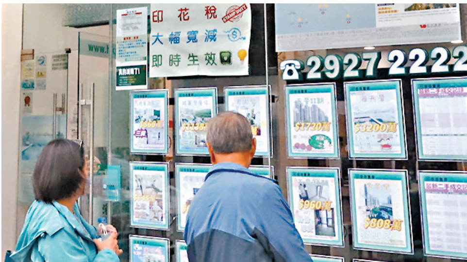
◆有興趣置業的受訪者當中，七成半表示等樓價再跌才入市。

是項調查結果為花旗銀行委託香港中文大學及善美佳市場顧問公司，以隨機抽樣電話訪問及街頭訪問形式，在9月就置業意向訪問超過1,100名香港市民綜合整理得出。