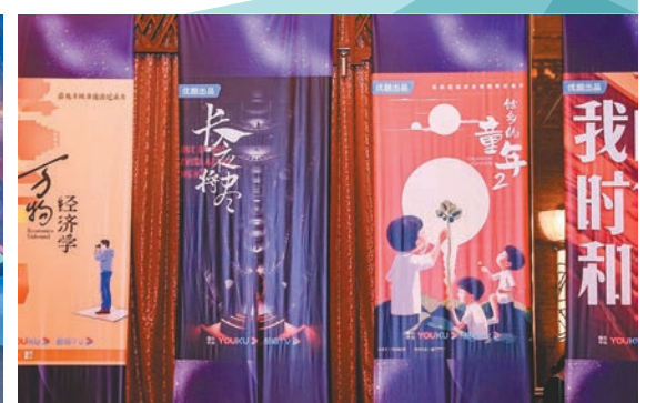
◆優酷發布2024重點紀錄片項目。

酷劇集頻道的「港劇場」非常火，在內地和香港都引起了很大的關注。」自詡為港劇迷的韓芸告訴記者，近期也正在積極推動執行落地的一個叫做《光輝歲月》的紀錄片項目，通過聚焦香港影視劇行業的金牌編劇，借助他們的視角來重新傳遞、探討經典港產影視劇背後的創作故事。「一個編劇的寫作，也代表着他們對時代和社會熱點