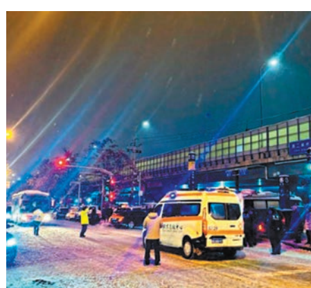
◆ 14日，消防、衛健等救援力量在緊急救援受傷乘客。

據北京地鐵通報，為確保極端天氣下，地鐵地面線和高架線路列車運行安全，北京地鐵所有地面線及高架線路均採用人工駕駛模式，採取降速運行措施，發車間隔將會適當拉大，沿線公家將加大運力接駁，乘客可按需選擇公家出行。