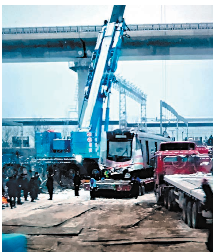
◆ 15日，事故列車被拖離。