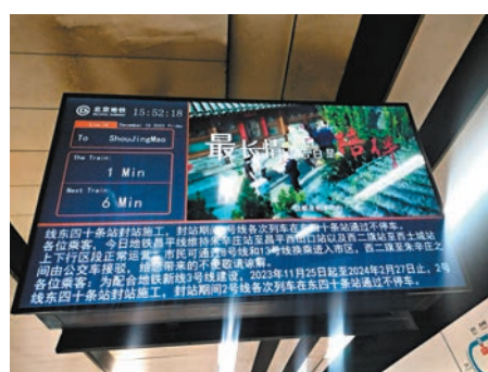
◆ 15日，北京地鐵內循環播放昌平線運營通知。