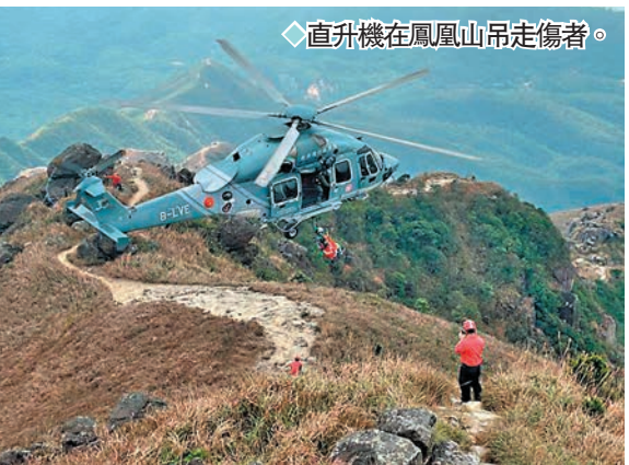
◆直升機在鳳凰山吊走傷者。

另外，昨日中午時分，政府飛行服務隊接獲在香港以南約36公里外担杆島對開有漁船沉沒，並有兩名船員墮海，飛行服務隊直升機及定翼機前往拯救。保安局晚上在社交平台發文指，昨日氣溫驟降，當時現場風速高達每小時74公里，海浪有5.5米高。據飛行服務隊拍攝的現場影片顯示，有船員抓緊一塊漂浮木板載浮載沉，空動員身繫吊索降落到海面，逐一將船員救起。