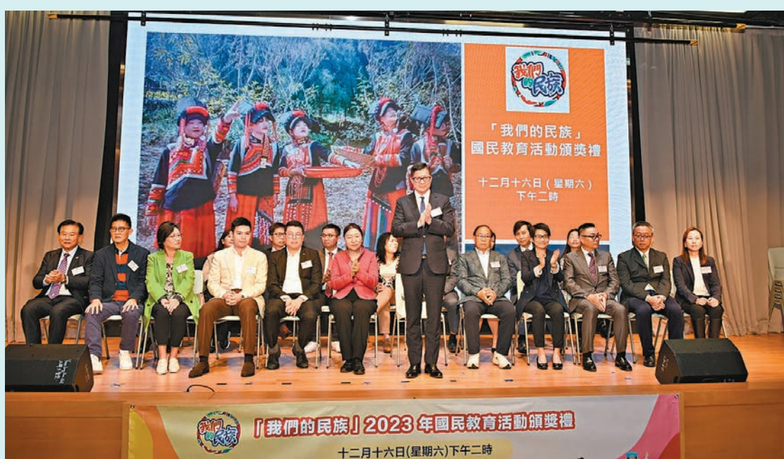
◆鄧炳強期望家長透過愛國主義教育，培養年輕人具有國家觀念、香港情懷及國際視野的新一代。

他表示，黎智英涉嫌長年勾結外力宣揚反中亂港主張，旗下的壹傳媒更長年抹黑內地，荼毒香港年輕人。身為香港青年，希望亂港黑手黎智英早日得到法律的制裁。