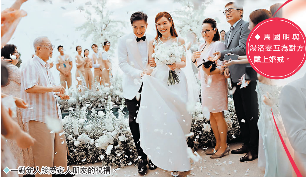
一對新人接受家人朋友的祝福。

完 成婚禮後的一對新人透過短訊感謝大家的祝福，他們說：「今個婚禮我們兩個都覺得好開心、好甜蜜，大家玩得好盡興，亦有好多感人的場面，好多賓客都有和我們講了好多說話和祝福。多謝大家關心，其他就見到大家的時候再回答，多謝多謝。」