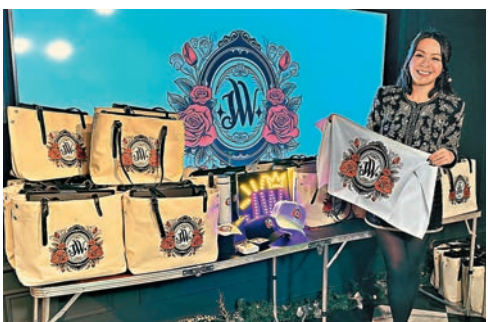
JW 設計了自己的專屬Logo。

除了送聖誕禮物，JW 還與粉絲一同唱歌、玩遊戲和交談。問到粉絲最關心的是否她的婚事？她即說：「唔係啲，她們很好，從來不會問我的私人生活，只會關心我的事業，而問得最多的是幾時開騷。其實一直都有計劃，但場地很多都爆滿了，希望明年能成事。」