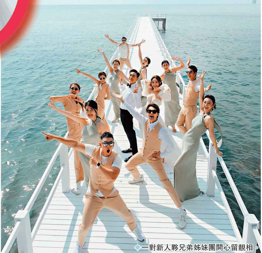
一對新人夥兄弟姊妹團開心留靚相。