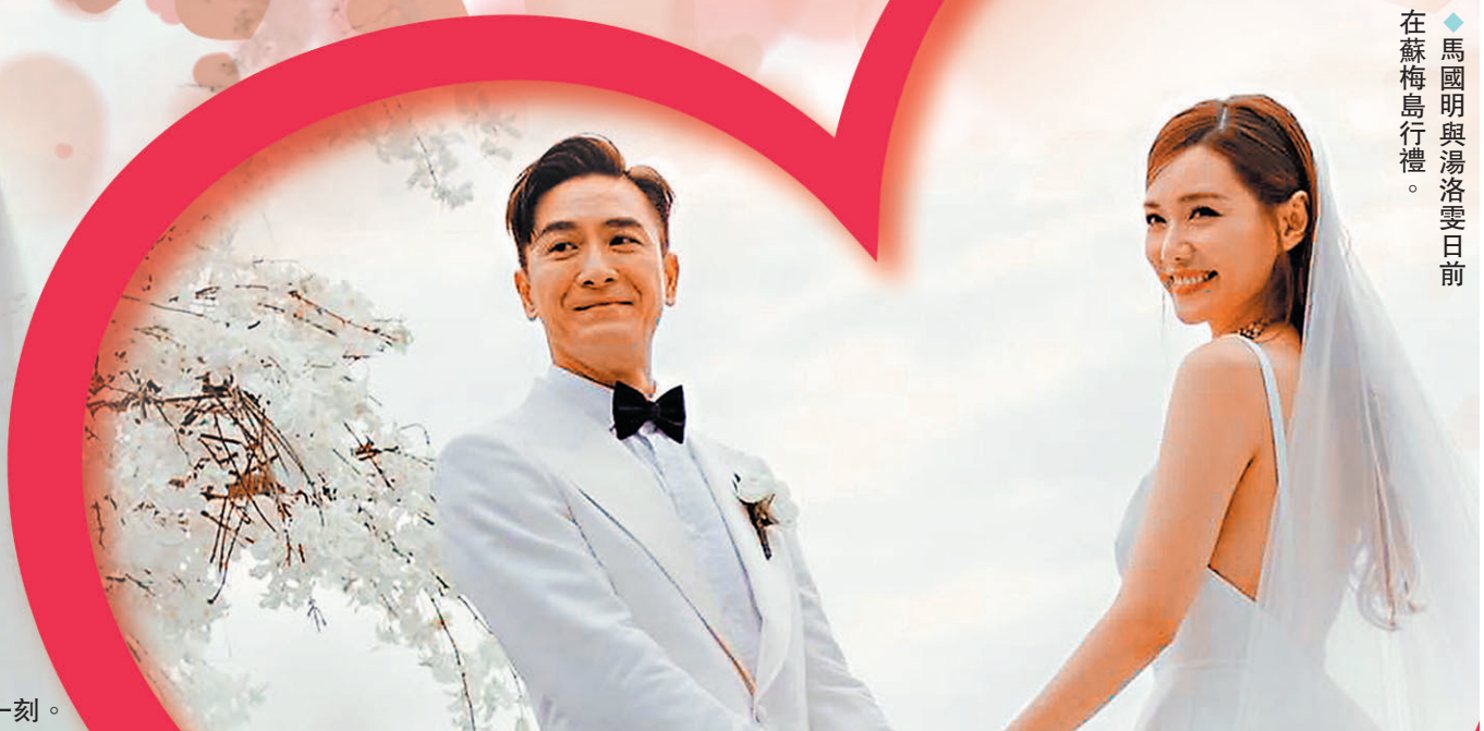
馬國明與湯洛雯日前在蘇梅島行禮。