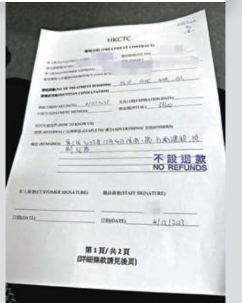
◆「治療師」以高壓手法「焗」記者購下逾3萬元的療程，合約上列明商戶是HKCTC。

涉事的「痛症中心」開業一年多，經常大灑金錢在社交媒體賣廣告，但隨著投訴人數愈來愈多，該中心一年內數度將社交媒體的賬號改名又改。在香港文匯報記者成功「放蛇」後不久，該中心又將HKCTC品牌改名，但營業地址和社交平台賬號卻無變，繼續處理痛症求助。記者發現，HKCTC並非公司名，而是品牌名，法律上品牌名不是「法人」，必須由持有該品牌的公司與客人簽約才有法律效力。而記者翻查多名苦主的服務合約，都是以HKCTC、已過時的平台賬號名義與苦主簽訂合約，換言之有關合約沒有法律效力，苦主也無法向一個品牌作出訴訟，淪為無頭公案。