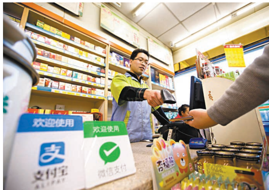
◆內地明年5月起實施《非銀行支付機構監督管理條例》。圖為民眾正在使用手機支付。

歷經近三年公開徵求意見後，在內地每年交易量逾1萬億筆的非銀行支付領域迎來重磅監管新規。國務院總理李強近日簽署國務院令，《非銀行支付機構監督管理條例》於17日正式發布，共6章60條，將非銀行支付機構及其業務活動進一步納入法治化軌道進行監管，自2024年5月1日起施行。新監管條例以國務院令的形式發布，提升了支付業務監管的法律層級和監管要求，強化對支付機構全鏈條、全周期的監管，嚴把支付機構准入關，防範業務異化、資金挪用、數據洩露等風險。◆香港文匯報記者 海巖 北京報道