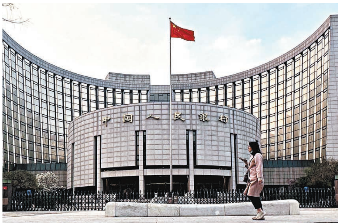
◆中國人民銀行將依法對非銀行支付機構實施監督管理。

在全周期、全鏈條監管方面，新條例加強機構監管和穿透式監管，加強功能監管，堅持「同一業務、同一標準」原則，避免監管套