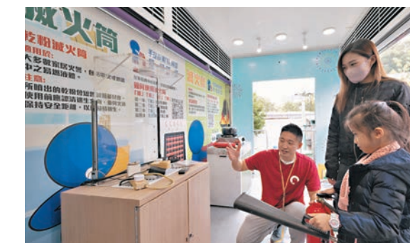
◆市民在消防處宣傳車上學習如何應對因煮食及電力故障引起的火警。

消防處處長(行動)黃鎮業率領屬員，聯同油尖旺區消防安全大使名譽會長會長及油尖旺區消防安全大使，向油尖旺區居民、舊式樓宇住戶及排檔商戶派發小冊子及紀念品，提醒他們注意防火安全。推廣家居手提滅火設備為活動的其中一個主題。為鼓勵市民自行在家居設置手提滅火設備(即滅火筒及滅火甕)，《2023年消防(裝置及設備)(修訂)規例》已生效，以豁免法定責任，市民無須每12個月安排註冊承辦商檢查這些手提滅火設