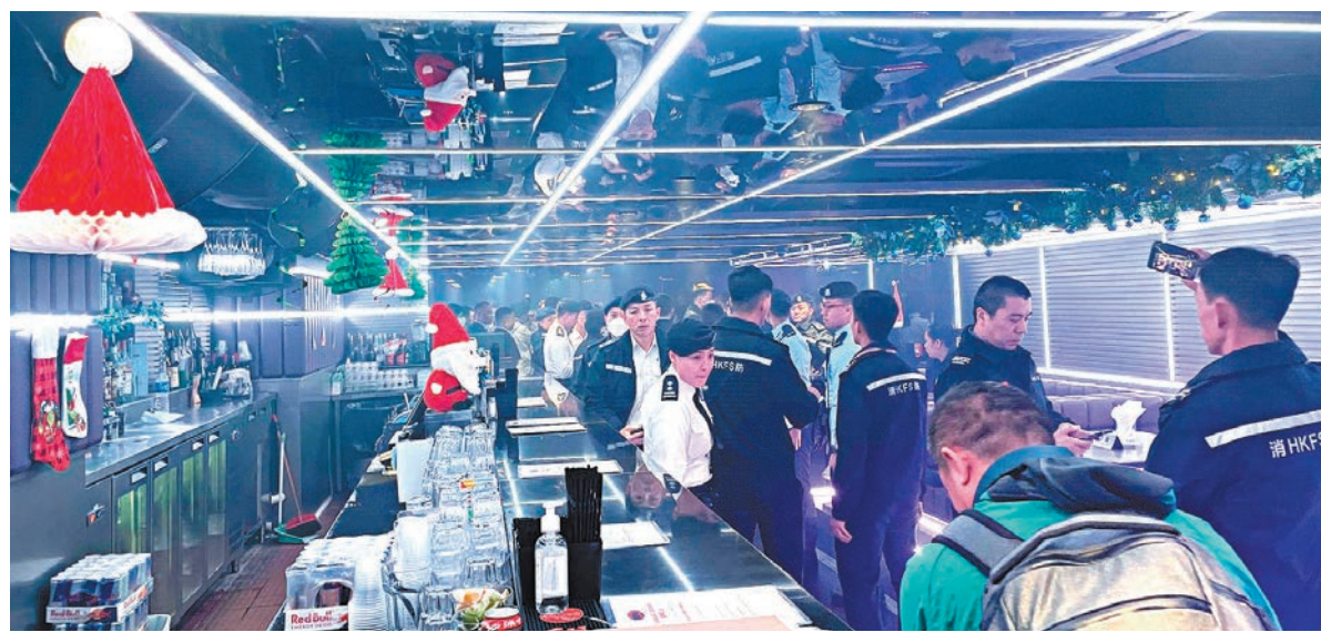
◆警員在中區一間娛樂場所內採取查牌行動。