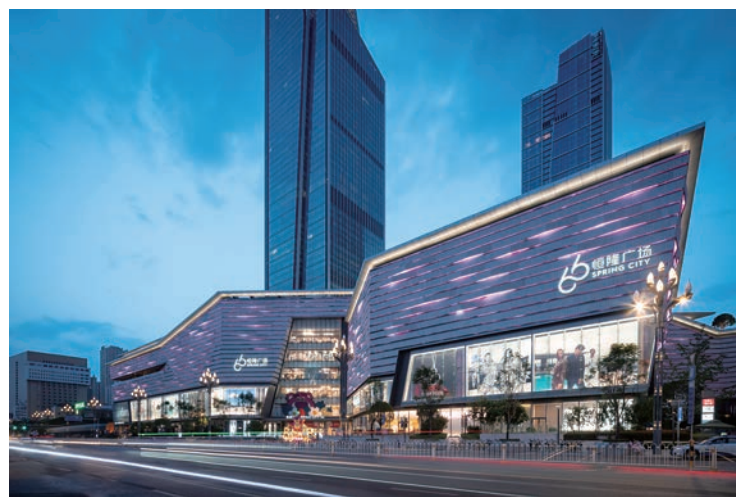
▲昆明恒隆廣場是恒隆首個使用100%可再生能源的物業。