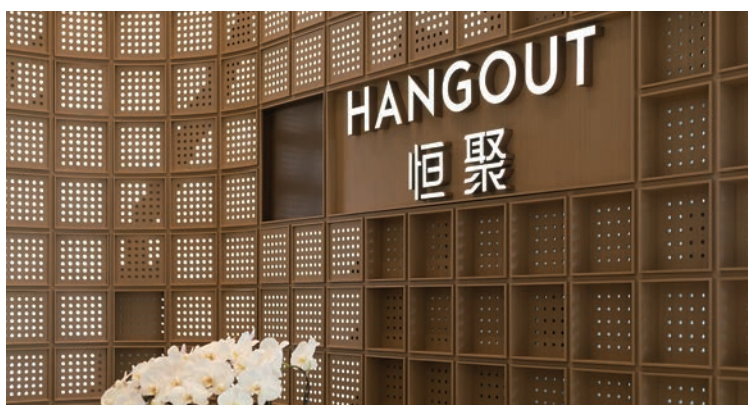
▲「HANGOUT 恒聚」於2020年在無錫恒隆廣場首次推出後取得鼓舞成績，相信未來在武漢亦會發揮獨特優勢和潛力，成為更多優質企業的首選商務辦公空間，引領新一輪的商務潮流。

可持續發展是恒隆的核心價值之一，亦是恒隆的業務重心。2020年，恒隆宣布2030年可持續發展目標及指標，聚焦於四個優先議題：應對氣候變化、資源管理、福祉及可持續交易。2021年，恒隆進一步制定了25個將於2025年底或之前實現的指標，為公司應對重大可持續發展挑戰制定具體及可量化的措施，同時為員工未來4年進行與可持續發展相關的工作釐定清晰目標，突顯恒隆矢志成為全球其中一間領先的可持續發展房地產公司之決心。