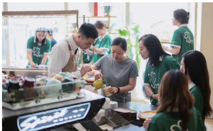
▲上海港匯恒隆廣場的義工隊聯同租戶為基層婦女舉辦咖啡拉花體驗工作坊，並品嚐特色甜品，讓她們得到放鬆休息。

恒隆每年9月份在香港和內地9個城市同步舉辦全國性周年義工日活動，以富有意義的方式慶祝集團周年慶。今年，義工日以「關愛婦女身心健康」為主題，逾1,200名恒隆一心義工隊的義工舉辦各具特色的活動，讓超過7,300名基層婦女及其子女舒展身心，減輕她們日常面對的工作及家庭壓力。這11年來，義工隊按當地社區的需要，重點開展女性賦能、青少年發展及教育、長者服務等各類義工服務，超過11,400名義工參與其中，累計服務時數逾135,000小時，共建多元共融社會。