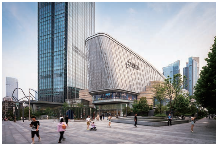
▲恒隆地產在華中的首個大型商業綜合體項目——武漢恒隆廣場。

在《推動共建絲綢之路經濟帶和21世紀海上絲綢之路的願景與行動》第六部分中，國家提出要加強「一帶一路」重要節點城市的建設，而恒隆業務投資所在地點正與之呼應。譬如向北開放的重要窗口遼寧（瀋陽），面向南亞、東南亞的輻射中心雲南（昆明），內陸開放型經濟高地武漢，恒隆都一一投資其中。其中，武漢恒隆廣場是公司在內地拓展的第10個項目，也是在華中的首個大型商業綜合體項目，為武漢高端商業市場注入新活力，以及為武漢消費者帶來一站式購物、休閒及娛樂的恒隆品牌體驗，引領武漢生活品味「一切從新」。