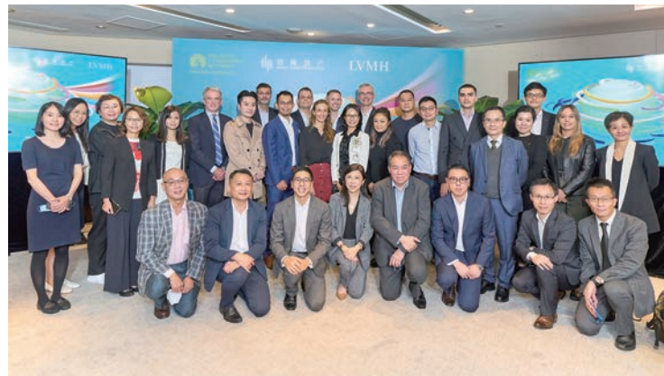
▲在香港的革新領袖及其他參加者聚首一堂，參加恒隆與LVMH集團舉辦的首屆地產與氣候論壇，共同探討氣候及可持續發展解決方案。

除此以外，2022年10月，恒隆更與全球奢侈品領導者LVMH集團宣布可持續發展合作協議，隨後更共同制定了高瞻遠矚的可持續發展行動議程。雙方於2022年11月合辦首屆地產與氣候論壇，請來數百位思想領袖和持份者聚首一堂，萌發超過200個構想，之後更發表「《共同憲章》：攜手合作，加速變革」，概述合作雙方將於2023年開始的20項創新行動。