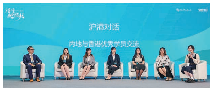
▲恒隆「她領航」計劃滬港交流。

首屆恒隆「她領航」計劃的圓滿結束體現了恒隆「聯繫顧客、社群、夥伴，實現可持續增長」的使命，以及在推動可持續發展方面的承諾。而為助力下一代年輕女性的成長賦能及多元發展，恒隆還將攜手更多志同道合的社會力量，打造更加多元共融的社會。