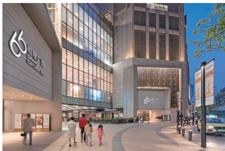
▲恒隆不斷鞏固在高端商場的領導地位。

恒隆地產有限公司（股票代號：00101）是香港和內地的頂級地產發展商之一，於香港上市並為恒生綜合指數、恒生股通高股息低波動指數、恒生可持續發展企業指數系列，及道瓊斯可持續發展亞太指數的成份股之一。恒隆在香港擁有龐大的投資物業組合，並在1990年代起逐步拓展內地市場，公司目前已成功進入上海、瀋陽、濟南、無錫、天津、大連、昆明、武漢及杭州的市場，旗下內地項目均以「恒隆廣場」命名。隨着不斷落子布局，恒隆地產正逐漸成長為一家全國性商業房地產公司。