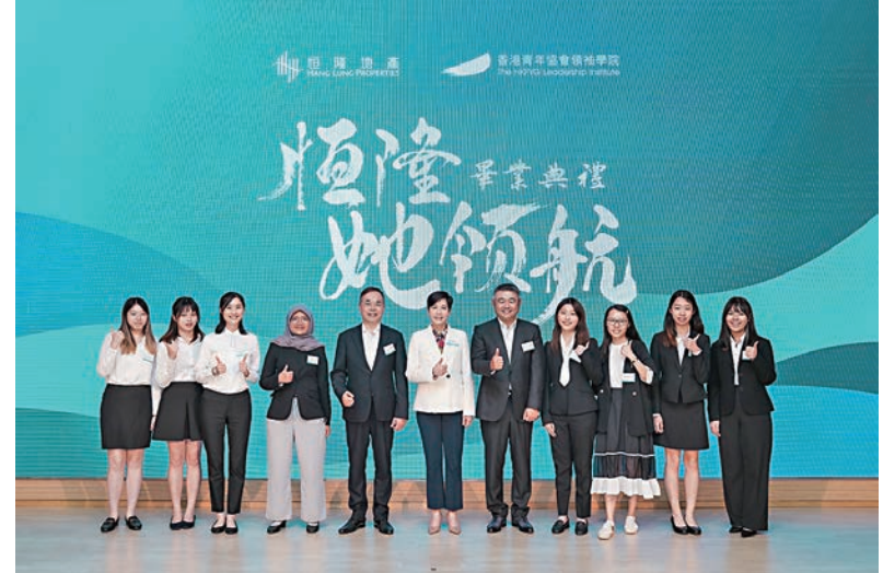
▲恒隆「她領航」計劃積極凝聚政府、業界、社會各方力量，關注及推動女性的發展，提升社會福祉。