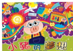
◆《小豬的夢想》封面。

這繪本藉簡潔的內容，可讓孩子了解到慾望與現實生活的平衡，同時對金錢的意義、如何規劃使用突如其來的收入，都有較深入的探討；家長透過故事，能趁機和孩子作親子對話，正好可當成父母和孩子間討論的最佳題材，及訓練孩子的「金流」控管呢。