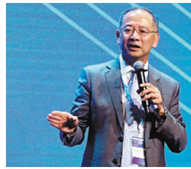
◆余偉文表示，現時香港的銀行按揭貸款質量穩健，不良貸款率很低。 資料圖片

對於環球經濟增長放慢，香港財赤增加，會否對香港金融體系構成壓力，余偉文對此表示，自零息年代起，香港做了多輪逆周期措施，雖然近年香港樓市回落兩成左右，出現負資產的情況，但這只是數字上的結果，最重要是借款人能否如期還款。他表示現時銀行按揭貸款質量穩健，不良貸款率很低，目前每1萬宗個案只有兩宗不良貸款的個案，因此香港金融體系仍然相當穩健。