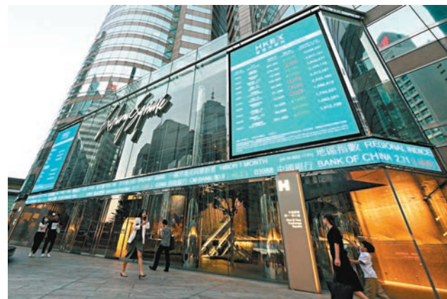
◆有分析指港股仍受多項不明朗因素困擾。 資料圖片

另一方面，本周內全球不同地區將有多項重要數據公布，或會左右環球金融市場表現。這些數據包括內地公布12月貸款市場報價利率（LPR）；美國公布11月PCE通脹數據；美國公布首次與持續申領失業救濟金人數數據；美國公布11月新屋銷售與耐用品訂單數據；歐元區公布11月通脹終值數據；日本公布11月通脹數據。此外，市場亦高度關注巴勒斯坦與以色列地緣政治局勢最新發展。